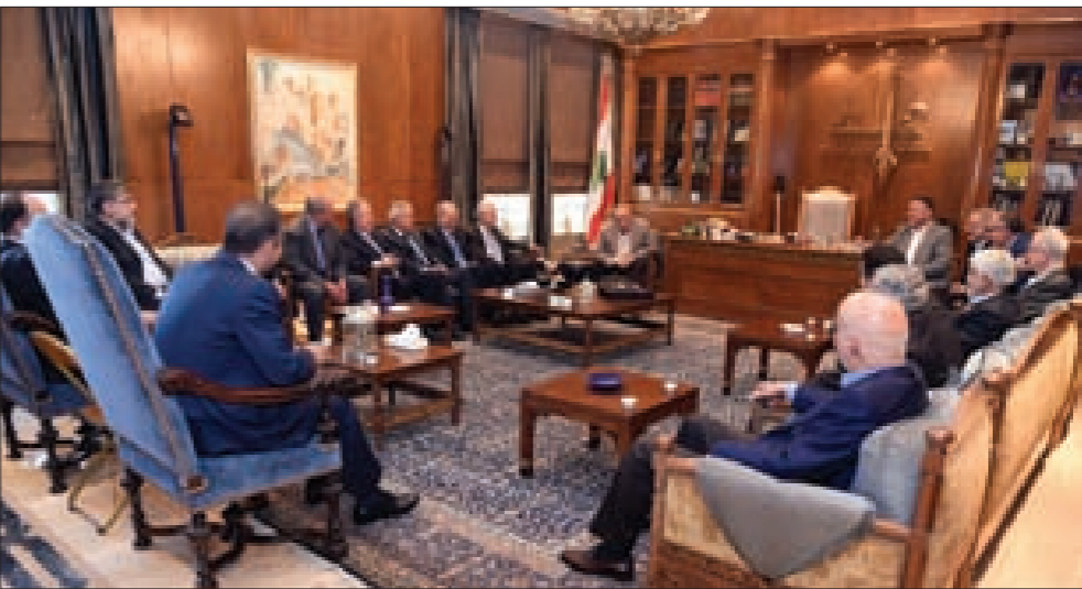
بري مجتمعاً إلى النواب خلال لقاء الأربعاء

شدد رئيس مجلس النواب نبيه بري في لقاء الأربعاء النيابي، على الالتزام بالدستور ومبادئه في مناقشة قانون الانتخابات النيابية، مشيراً إلى أن اللجان المشتركة مدعوة لمناقشة مشاريع واقتراحات القوانين المتعلقة بالانتخابات بمسؤولية وجدية للوصول إلى أقل نسبة من الائتلافات والفروقات لمناقشتها في الهيئة العامة.