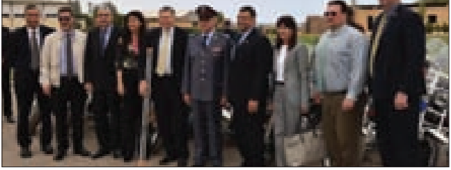
جانب من الاحتفال

تمّ أمس في تكية اللواء الشهيد وسام الحسن في الضبية، حفل تسلّم هبة أميركية لمصلحة المديرية العامة لقوى الأمن الداخلي، وهي عبارة عن أربعين دراجة آلية نوع «هارلي ديفيدسون»، وأربع آليات للركاب (فان) وخمس حفلات نقل. حضر الاحتفال ممثل المدير العام لقوى الأمن الداخلي اللواء إبراهيم بصبوص، قائد وحدة القوى السيارة بالوكالة العميد فادي الهاشم، القائم بأعمال السفارة الأميركية في بيروت السفير ريتشارد جونز ومدير مكتب إنقاذ القانون ومكافحة المخدرات في أفريقيا والشرق الأوسط لدى وزارة خارجية الولايات المتحدة الأميركية انطوني فرنانديز. ووقف من السفارة الأميركية، إضافة إلى عدد من الضباط.