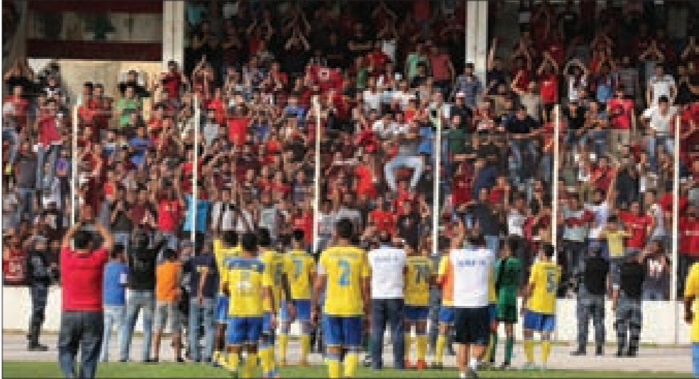
لاعبو الصفاء يشكرون جمهور النجمة على تشجيعهم