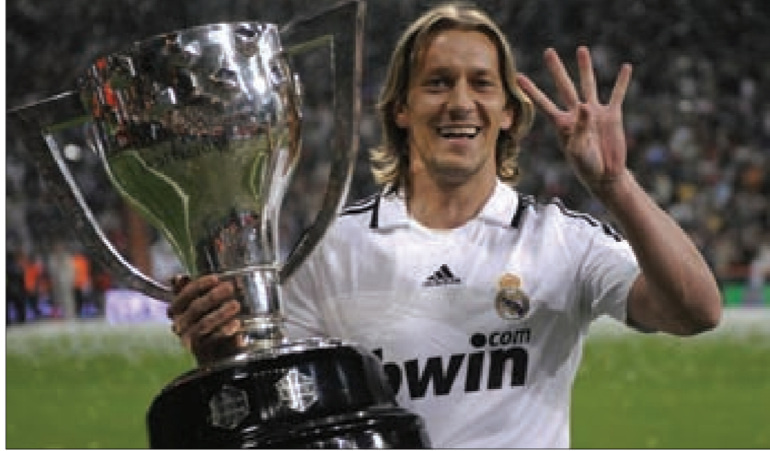
سلغادو أيام عزّه مع ريال مدريد

برعاية وزير السياحة ميشال فرعون وحضوره، وبمبادرة من شركة «أرابيكا سبورت»، يُقام اليوم في تمام الساعة 12.00 ظهراً في فندق «لو غراي» - وسط بيروت، حفل الإعلان عن «مباراة العمر»، التي ستجمع عدداً من نجوم كرة القدم العالميين ونجوم لبنان في العاشر من شهر أيلول المقبل على ملعب الرئيس فؤاد شهاب في جونبة. هذا، وسيحضر الحفل نجم ريال مدريد السابق الإسباني ميشال سالغادو والكابتن التاريخي لمنتخب لبنان رضا عنتن، بالإضافة إلى عدد من الشخصيات الاجتماعية، الفنية والرياضية. ويعتبر هذا الحدث من أهم الأحداث الرياضية التي ستقام في لبنان هذه السنة، لكونه سيساهم في ترويج الصورة الإيجابية عن لبنان على أكثر من صعيد، نظراً لترقب حضور أسماء كبيرة سبق ولمعت في سماء اللعبة الشعبية. وخلال المؤتمر الصحافي سيكشف النجمان الإسباني واللبناني عن الأسماء التي سيتألّف منها فريقهما، حيث يتوقع أن يحضر 8 من أبرز النجوم العالميين أصحاب الأسماء الكبيرة إلى بيروت لخوض المباراة، في خطوة ستفاجئ الرأي العام الرياضي، وخصوصاً أنّ هؤلاء النجوم لعبوا لأهم الأندية والمنتخبات في العالم وحصدوا معها الكثير من الإنجازات. ويأخذ الحدث بُعداً رياضياً وأخر سياحياً، إذ إنه يؤكّد أنّ لبنان يمكنه استضافة حدثاً كبيراً من هذا النوع، كما أنه بإمكانه رغم كل الظروف البقاء بين طليعة الدول السياحية في المنطقة، حيث سيرحب الشباب العربي بفكرة القدوم إلى لبنان لمتابعة هؤلاء النجوم عن كثب في «مباراة العمر».