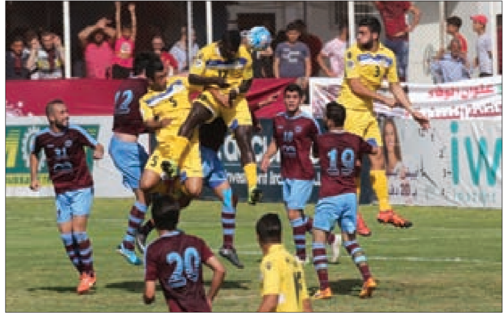
لقطة من مباراة النجمة والعهد

تنتقل غدًا المرحلة 21 ما قبل الأخيرة من بطولة لبنان لكرة القدم، وعلى جدولها مباريات من العيار الحساس على صعيد السقوط (السلام زغرتا - الشباب الغازية) بالإضافة إلى اللقاء الإبرز، والسذي سيجمع بين العهد والأناضول، فيما المتصدر الترتيب الصفاء سيواجه شباب الساحل وعينه على نقاط تحقيه محققًا بانتظار لقائه المرتقب مع العهد في المرحلة الأخيرة من البطولة.