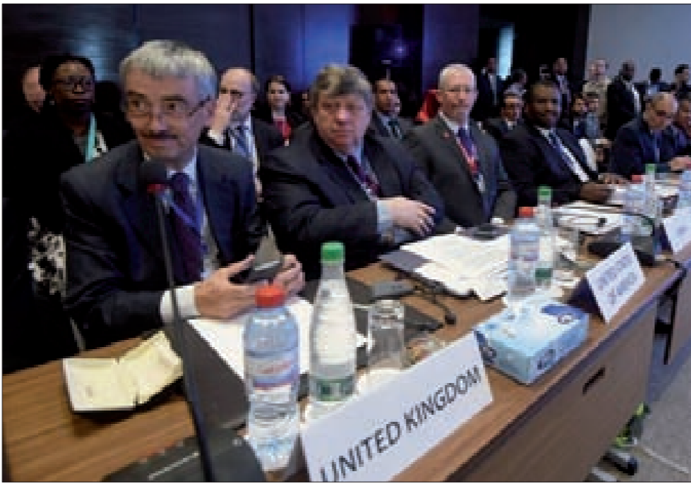
دول فيينا تبدأ بالمسار الليبي...

روسيا الحيد فيها، ولن تنفع معها معادلة حيايد ميداني أميركي مقابل مثيله روسيا، وما جرى قبل شهر كاف لتقديم الجواب، والنتيجة ستكون من المواجهة، هي التي كانت تبدو في طريق ارتسامها قبل الإعلان عن الهدنة منذ شهرين، مع فارق ما سيترتب من ضراوة وخراب ودماء بفعل تحشيد «النصرة» وأعوانها من رجال وسلاح وما قدّمه وسيقدّمه السعوديون والإتراك من دعم للجماعات المسلحة في هذه الحرب، لكن لن يكون متاحاً صناعة نصر على سورية وحلفائها ولا إقامة توازن بوجههم، بينما ستختبر اليوم الفرضية السعودية التركية القائمة على تورّط «إسرائيلي» مباشر ربما يكون اغتيال الشهيد مصطفى بدر الدين مؤشراً عليه، للنجاح في إقامة توازن يمنع الحسم العسكري، مع الكلام السعودي عن توفير سلاح أشدّ فتكاً للجماعات المسلحة، وبالتالي الخروج بموقف متشدّد يدعو لتعديل التفاوض بتوسيع نطاق الحديث عن فرصة لـ«جيش الإسلام» و«أحرار الشام» لتطال النصر أيضاً، وبدلاً من جعل العداء لـ«النصرة» مقياساً، جعل العداء لـ«داعش» المقياس، وتقديم مقاربة تركية سعودية فرنسية بريطانية لاختبار استعداد «النصرة» للمشاركة في الحرب على «داعش» من ضمن شمولها بأحكام الهدنة، وهو ما سبق وطرحه كيري على لافروف وجوبه بالرفض.