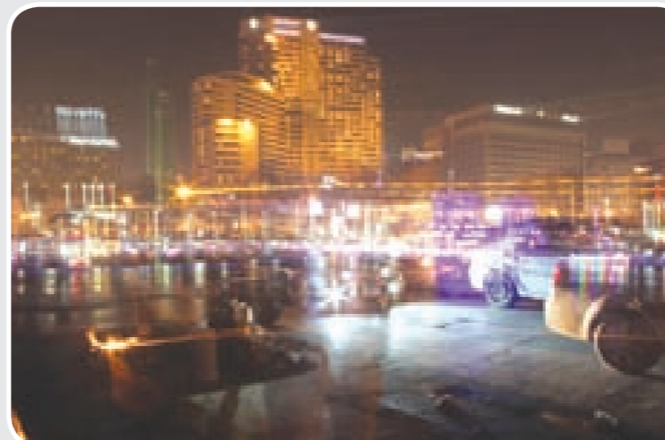
كوبري قصر النيل