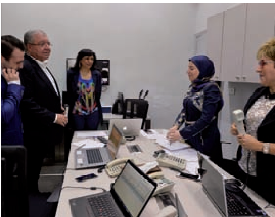
المشوق خلال تقفده غرفة العمليات المركزية في وزارة الداخلية أمس

التشكيلات الإرهابية. لبنانياً، كان الحدث شمالياً حيث اليوم الأخير للانتخابات البلدية، وطرابلس عاصمة الشمال وعرين تيار المستقبل وخزانه البشري كانت شاهداً على إعلان نهاية هذا التيار وتحوله من زعيم تشكيل اللوائح الانتخابية إلى ملحق بمن يشكلون اللوائح، فُضِّفَاف إلى ما جرى شمالاً في طرابلس والضنية والمدينة وعكار من إشارات لتفكك التيار وفقدانه المبادرة، ظهور تسابق على من يرث تركة الرجل المريض، ففي طرابلس برز الرئيس نجيب ميقاتي كرافعة للتحالف الذي ضمّ الوزيرين السابقين محمد الصفدي وفيلسوف كرامي والجماعة الإسلامية وجمعية المشاريع الإسلامية، بينما قاطع الحزب العربي الديمقراطي بلدياً وانتخب اختياريًا ليكشف جملاً ناخباً وازناً، وبدا الوزير أشرف ريفي منشقاً علناً عن المستقبل ومانحاً على الوراثة بقوة وصاحب الحصة الأكبر في تركة الرجل المريض بالخرق الذي تمكن من تحقيقه للألحقة الانتخابية، وبدت الجماعة الإسلامية التنظيم المستعد لنسبة جيدة من الميراث، بينما استعد منافسو المستقبل في مناطق حيوية حضورهم كحال النائب السابق جهاد الصمد في الضنية بوجه النائب أحمد فنتق، بينما ظهر الحزب السوري القومي الاجتماعي الذي حصد نتائجه المتوقعة الوازنة في قضاء الكورة، وأظهر حضوره المنتمشي على مساحة أفضية الشمال، بصفته البصمة الحزبية والسياسية التي غابت لولاه عن انتخابات الشمال، حيث طغت المحلية والمناطقية والمصلحية على التحالفات، فظهرت زغرماً معقودة لزعيمها الوزير السابق سليمان فرنجية بتحالف مع آل معوض، وبشري بعنوانها القواتي، والبترون بتقاسم الوزير جبران باسيل للساحل مع الوزير بطرس حرب للجبيل، وبقيت عكار خليطاً تنافس وتحالفات. (النتمة ص6)