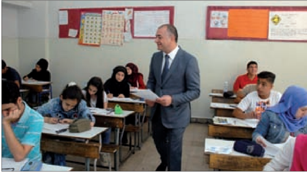
بوصف في أحد مراكز الإمتحانات