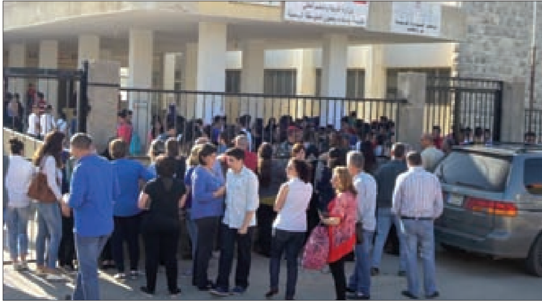
جمهور من الاهالي أمام متوسطة مرجعيون الرسمية