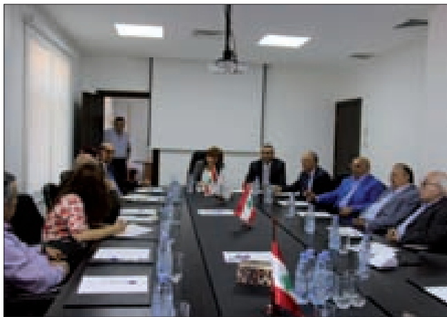
عباس مجتمعاً إلى تجار ومستوردي السلع الغذائية

وخلق أجواء استهلاكية مريحة، بين التجار في الأسواق مما سينعكس خصوصاً أنّ المنافسة على أشدها إيجابياً على الأسعار».