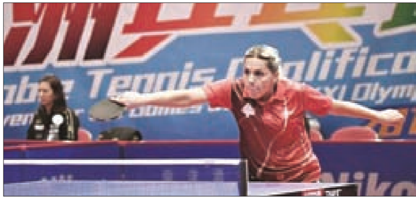
دورة الألعاب الأولمبية الصيفية التي ستقام في ريو دي جانيرو (البرازيل) في آب المقبل.