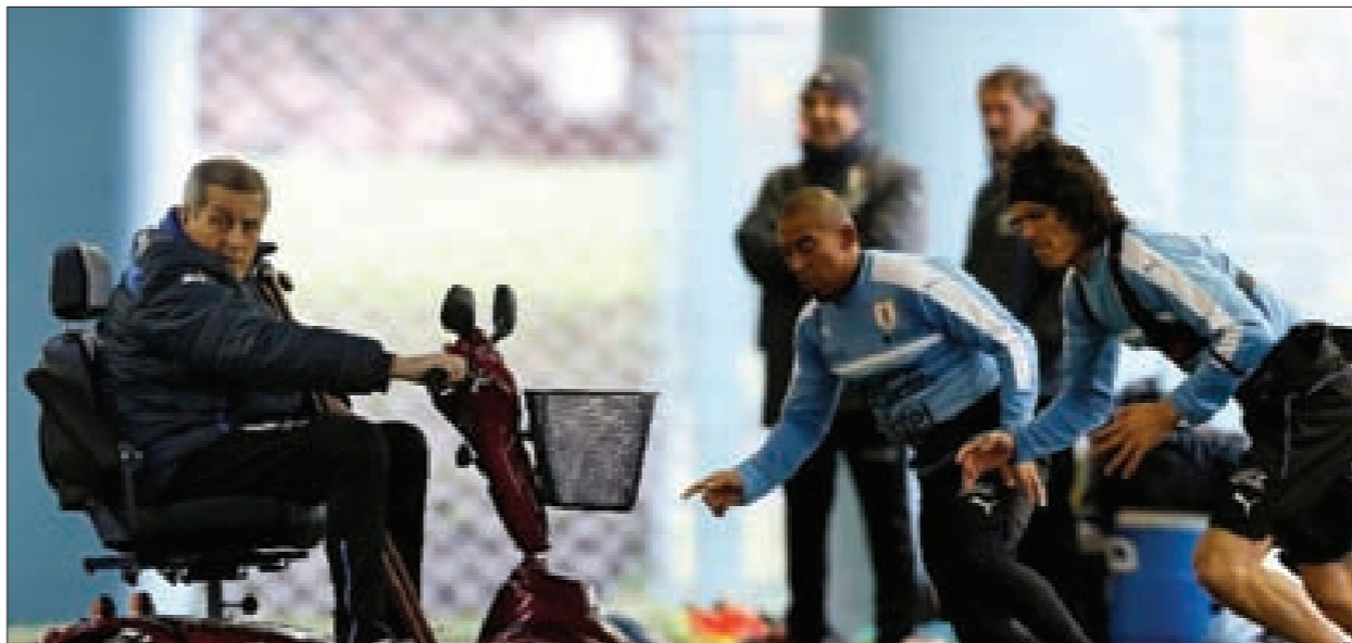
من تمارين منتخب الأوروغواي

وتتمسك الأوروغواي بالمدرّب البالغ من العمر 69 والذي بدأ مهامه العام 2006، إذ يُعتبر تابارين أحد أكثر الرجال خبرة في إدارة منتخب بلاده بالشكل الأمثل، خصوصاً أنّه توجّ بكوبا أميركا 2011، وحل رابعاً في مونديال 2010 بجنوب أفريقيا.