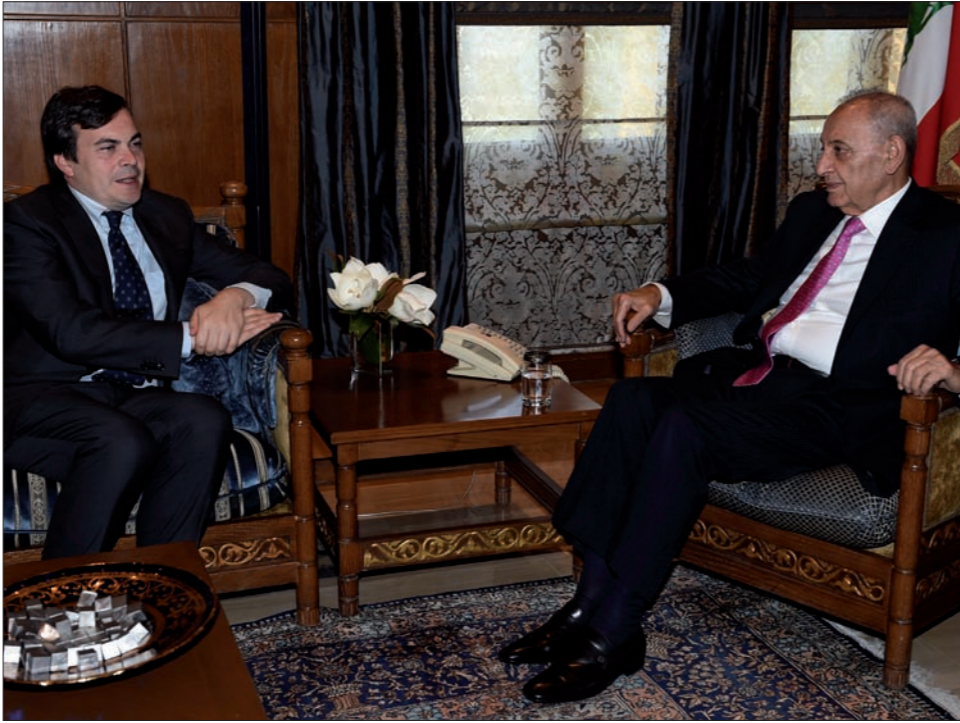
بري مستقبلاً نائب وزير الخارجية الإيطالي

وأجزاء من محافظة حماة واهتزت الأرض من شدتها، فهي صادرة عن تفجير وتدمير كامل لمستودعات جبهة النصر تحت الأرض في معسكر بلشون.