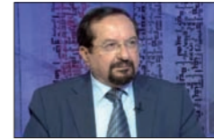
د. عصام نعمان

في غمرة الانتخابات البلدية تفجّر مزاج الناس وانقسم قرارهم. مزاجهم ازدراء بالقيادات السياسية التقليدية وأدائها الفاشلة لأمس حدود القرف. ما عاد بمقدورهم احتمال بلاذم المسؤولين وعجزهم. اليأس منهم قادهم إلى تفضيل نقيضهم، أحياناً، مع علمهم أنهم ليسوا بالضرورة أفضل منهم. أليس هذا ما حدث في طرابلس؟