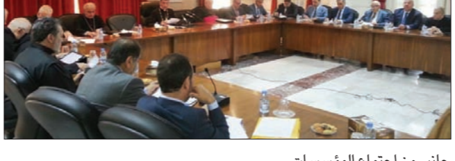
جانب من اجتماع المؤسسات