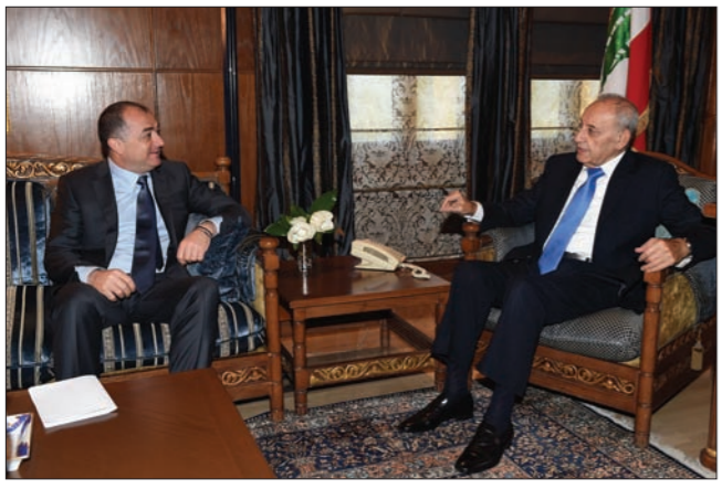
بري مستقبلاً بوصعب

عرض رئيس مجلس النواب نبيه بري في عين التينة مع وزير التربية ياسر بوصعب الأوضاع العامة وشؤوناً تربوية.