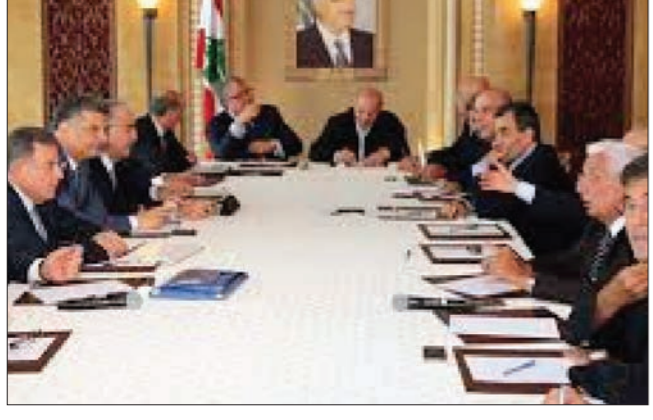
جانب من اجتماع «المستقبل»

أكدت كتلة «المستقبل» النيابية بعد اجتماعها برئاسة النائب فؤاد السنيورة «تمسكها بضرورة التوجّه لانتخاب رئيس الجمهورية»، مشددة على «دعوتها لجميع القوى السياسية للعمل الجدي لانتخاب رئيس الجمهورية الذي يجب أن يحظى بدعم اللبنانيين ويكون عوناً لاجتماعهم لا سبباً لتفريقهم، ويقوم بدوره في حماية الدستور وفي إعادة الاعتبار للدولة ومؤسساتها، والتصدي للمؤامرات والمخاطر ولا سيما إزاء تلك التي يتعرّض لها لبنان في ظلّ الأوضاع الخطيرة والمتدهورة والمشتعلة في المنطقة».