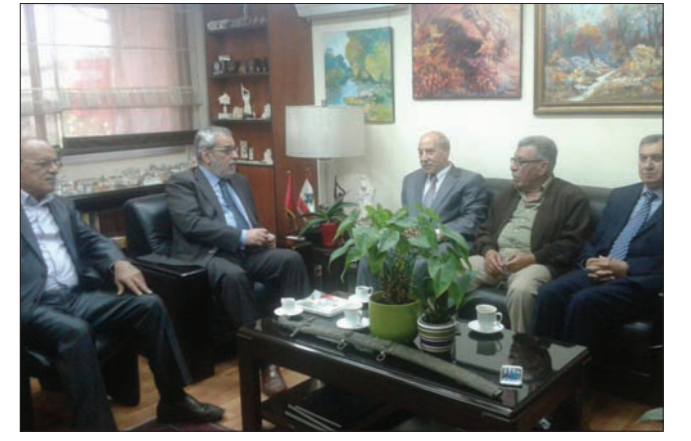
بقرادونيان مجتمعاً إلى وفد «الديمقراطية»

الآزمة في لبنان والمنطقة، انطلاقاً من أنّ الفلسطينيين ليسوا جزءاً منها وأولوياتهم كانت وستبقى النضال من أجل حقوقهم الوطنية، خاصة حق العودة والحفاظ على سيّدهم الفلسطيني في لبنان على استمرار نضالهم لانّزعاج حق عودة اللاجئين وفقاً للقرار 194». كما أكد الوفد «ضرورة مواصلة الجهود المبذولة من قبل جميع القوى الفلسطينية واللبنانية لضمان استقرار الأوضاع المخيمات وتعزيز علاقاتها مع الجوار،