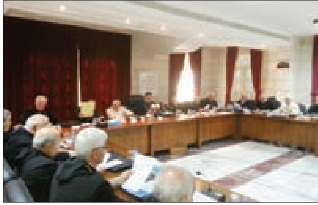
جانب من جلسة الافتتاح

بدأت في الصرح البطريركي في بكري صباح أمس، أعمال سينودس الكنيسة المارونية برئاسة البطريرك الكاردينال بشارة الراعي ومشاركة مطارنة الطائفة في لبنان وبلدان الانتشار. وستقسم أعمال السينودس إلى قسمين، الأول: رياضة روحية تستمر لغاية يوم السبت المقبل، ويتولى الإرشاد الروحي الرئيس العام لجمعية المرسلين اللبنانيين الموارنة الأب مالك أبو طانوس. والقسم الثاني يبدأ الإثنين في 13 الحالي حيث تبدأ أعمال السينودس الإدارية والكنسية وأوضاع الأبرشيات وتستمر حتى نهاية الأسبوع، حيث سيصدر بيان ختامي يتناول المواضيع كافة التي تمّ بحثها. وألقى الراعي كلمة دينية في الافتتاح.