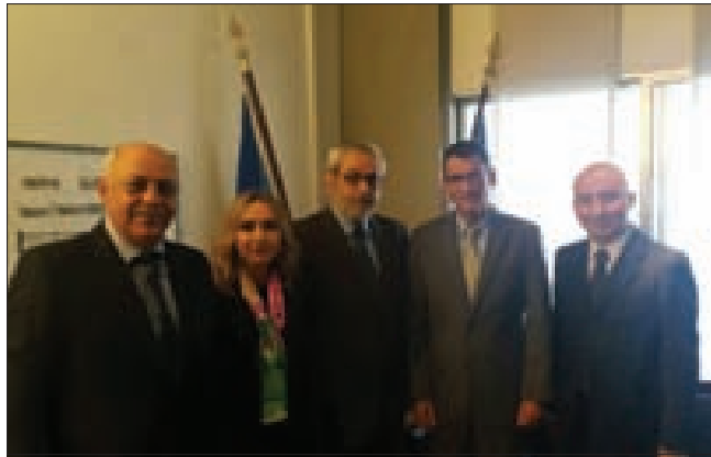
هوث مع الوفد الأرمني

استقبل رئيس مجلس الوزراء تام سلام، الأمين العام لحزب الطاشناق هاغوب بقرادونيان ونائبه أوديس كيدانيان، وجرى عرض للأوضاع والتطورات. من جهة أخرى، زار بقرادونيان على رأس وفد من اللجنة المركزية للحزب ولجنة الدفاع عن القضية الأرمنية السفارة الألمانية والتقى السفير الألماني مارتين هوث. وأشاد بقرادونيان، باسم كتلة نواب الأرمن بقرار مجلس النواب الألماني بالاعتراف بالإبادة الأرمنية، معتبراً ذلك «انتصاراً للحق والعدالة»، وأعرب عن أمّله في «أنّ تمثّل برلمانات دول أخرى بمجلس النواب الألماني، مدركين أنّه لا يمكن إنكار الحقائق التاريخية». وأشار إلى «أنّ اعتراف تركيا بالإبادة الأرمنية سيساهم إلى حدّ كبير في تطبيع العلاقات الأرمنية – التركية، وتسوية نزاع قره باخ، ما يضمن المساهمة في تعزيز السلام والاستقرار في المنطقة». بدوره، أكد السفير الألماني «أهمية توقيت اعتماد هذا القرار»، معتبراً أنّ اعتراف مجلس النواب الألماني بالإبادة الأرمنية أتى في مرحلة دقيقة جداً في العلاقات الألمانية – التركية، حيث تبدّل ألمانيا جهوداً كبيرة لإيجاد حلّ لأزمة اللاجئين بالتنسيق مع تركيا». وقال: «إنّ هذا الأمر يؤكّد قناعة مجلس النواب الألماني بصوابية مواقفه في هذا الموضوع». وفي نهاية اللقاء، عبّر هوث عن امتنانه بوجود كسفير ألماني في لبنان في هذه المرحلة التاريخية، مؤكداً أنّه سينقل جميع الرسائل والمواقف الإيجابية إلى حكومته.