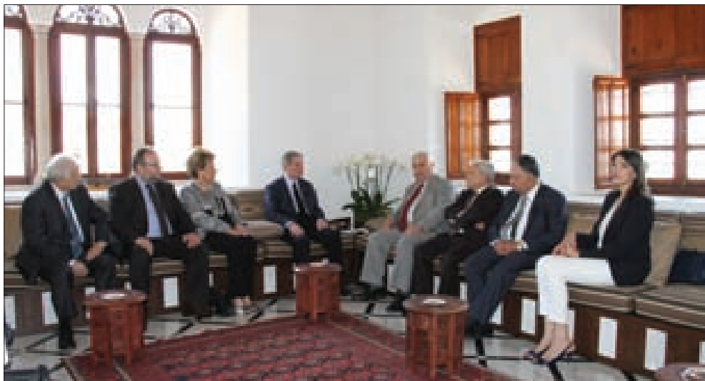
الجميل مع وفد الرابطة

ورداً على سؤال عن الجولة على الشخصيات السياسية من أجل انتخاب رئيس للجمهورية وطرح اسم معين، قال: «نحن لا ندخل في لعبة الأسماء، وللرابطة المارونية كلمة بشأن المواصفات، المهم أن يكون شخصاً تاريخه بنى مستقلة، ولا نريد أن نقوم بمحاكمة نيّات بالنسبة للأشخاص وللمرشّحين. بالنسبة إلينا تاريخ الشخص أساسي، وما هو معلوم عنه أيضاً أساسي، وبعيداً عن دورهم كفاعل من دون أي تقاعس، وأن تكون الميثاقية فعلية، فيجب على الرئيس العتيد أن يؤمن بهذه المبادئ». وزار وفد الرابطة أيضاً الرئيس ميشال سليمان بحضور وزير شؤون المهجرين ليس شبطيني.