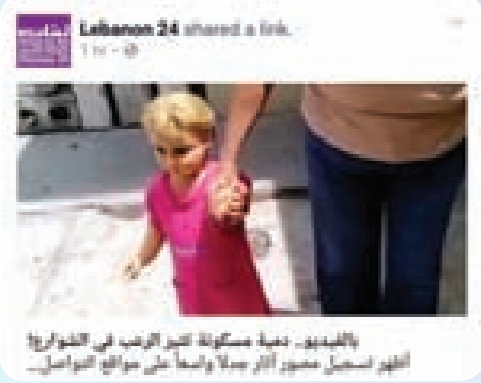
بالفيديو: دمية مسكونة تثير الرعب في الشوارع! أظهر تسجيل فيديو لطفلة صغيرة وأبها على مواقع التواصل.

أظهر تسجيل مصور أنصار جدلا واسعاً على مواقع التواصل الاجتماعي، امرأة مكسيكية وهي تمسك بيد دمية كبيرة وتمشي برفقتها أمام منزلها، بحسب ما ورد في صحيفة «السنديا إكسپريس» البريطانية.