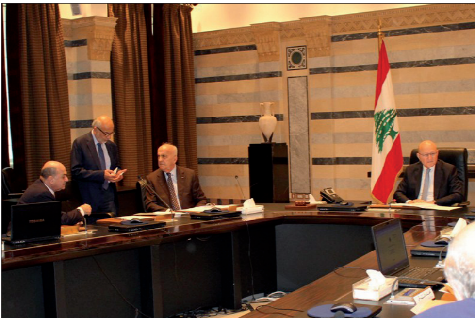
جانب من جلسة مجلس الوزراء في السراي أمس (الدالتي ونهرا)

«قوات سورية الديمقراطية» إذا اقترحت موسكو دعوتهم إلى جنيف، وعارضت أنقرة والرياض. هدنة وجنيف بمن حضر عنوان المقترح الذي تقدم به الرئيس الروسي فلاديمير بوتين للأمين العام للأمم المتحدة بان كي مون والمبعوث الأممي إلى سورية ستيفان دي ميستورا، اللذان سيشاروان الأميركي قبل اتخاذ أي موقف، فإن رفضت واشنطن صارت الحرب التي تخوضها سورية وحلفاؤها مشروعة بلا قدرة احتجاج ونفاذ صبر أميركيين، وإذا قبلت واشنطن بدأ فك وتركيب المعارضة وتحديد الأحجام الإقليمية الجديدة لتركيا والسعودية، وصارت للحرب روزنامة سياسية وليس فقط جدول أعمال عسكري. لبنانيا، تحولت جلسة الحكومة إلى حوار ساخر من التقرير الفضائحي الذي قدمه وزير الاتصالات بطرس حرب عن قرصنة الانترنت وجاء خالياً من أي شيء يتصل بالملف بداعي إعدام التقرير قبل شهر، وخالياً من كل جواب على أسئلة تمديد عقود الخليوي والتعاقدات بين الوزارة و«أوجيرو» من وراء ظهر الحكومة وسواها من القضايا الإشكالية، وختمت الفضيحة بمنح الوزير المقصر مهلة أسبوعين لإعداد التقرير المطلوب. سياسياً بينما تشهد كل جبهات السجال هدوءاً يبدو متفكراً عليه، ويعتمد الفرقاء الصمت، تجاه قضايا الخلاف وتؤجل الملفات (التمتة ص6)