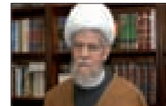
العلامة الشيخ عفيف النابلسي

تُبل مملكة آل خليفة حلول العقل والحكمة، وتستبدل القانون بالمخابرات والعمل البوليسي الترهيب مع شعب قَدِم أروع مثال في المطالبة السلمية عن حقوق له مشروعة. تجنبت المملكة الإصغاء للناس ووجدت أن القمع هو السبيل لتدجينهم وإيقافهم عند حد لا يتجاوزونه! تظهر المملكة من خلال وسائل إعلامها أن غزواً خارجياً يهدد كيانها وليس شعباً مهمشاً ومحروماً ينزل إلى الشوارع بسبب التمييز والعنصرية والسياسات الطائفية التي تسعى لتبديل شعب أصيل بأشخاص طارئین يجنسون لتغليب فئة على فئة، ومع ذلك هي تصر على أن تسجل لنفسها براءة أبدية في العفة والتسامح والالتزام بالمسؤولية تجاه مواطنيها! فكيف ذلك ومسلسل العنف الذي تمارسه حكومة آل خليفة في البحرين متواصل بوتيرة متصاعدة بحملات قمعية، واعتقالات تعسفية، وسحب الجنسية عن رموز أصيلة ومتجذرة في البلاد، ثم تجميد عمل جمعيات معارضة كجمعية الوفاق (النتمة ص6)