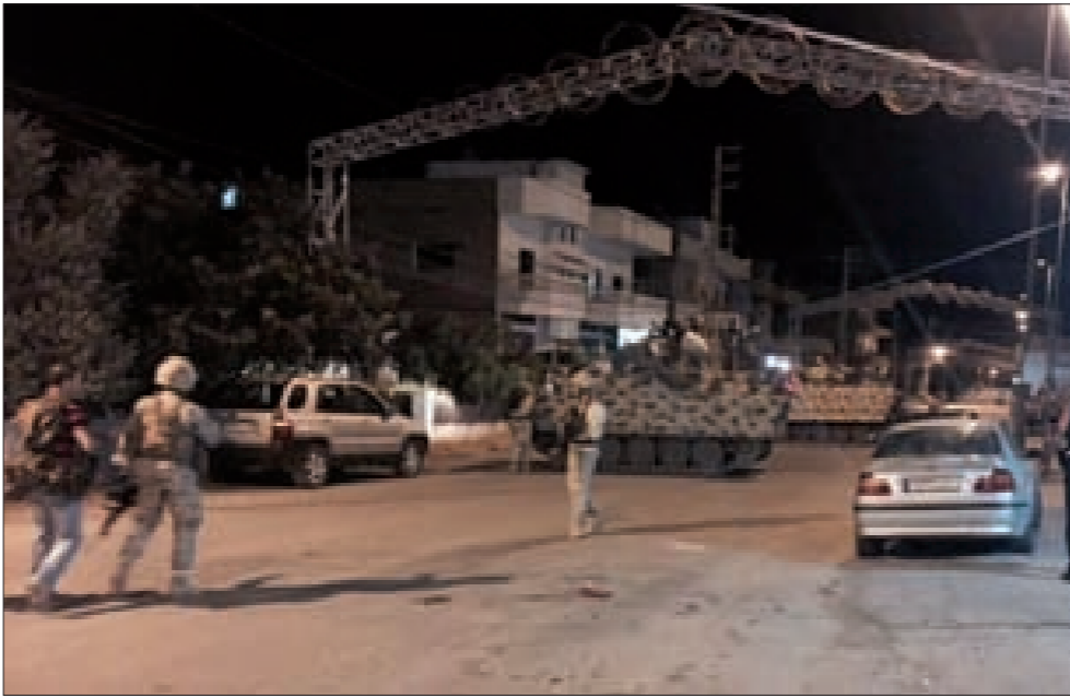
تعزيزات كبيرة للجيش في القاع عقب التفجيرات الإرهابية مساء أمس (أحمد موسى)

الروسي عن إسقاط الطائرة الحربية الروسية قبل عشرة أشهر، بعد عناد ورهان على التصعيد، يصير ذلاً لا مشكلة فيه إذا كان الباب لتخفيض حجم الدعم الروسي للخصومة الكردية، التي تموضعت في الحزن الأميركي. يقرأ الخبراء الأتراك في كتاب خروج بريطانيا من الاتحاد الأوروبي غير متأسفين على عدم الانضمام لكيان هش صار في طريق الزوال والتفكك فينوجهون بالنصح لأردوغان برسم خطوط الأمن القومي التركي بتخفيض التوتر مع الجوار وصولاً إلى مصر، ولو كان الثمن الخروج التركي من اللعبة الأخوانية. فقد قدمت تركيا لهذه اللعبة الكثير من رصيدها، وأن الأوان ليسد الأخوان بعضاً من فواتير الدين لتطبيع علاقات تركيا بروسيا وإسرائيل ومصر، مع التسليم بالحاجة الماسة لرسم سياسة جديدة تجاه سورية، بعد استكشاف حجم الاستعداد الروسي الإيراني للانفتاح والثقة بالتعاون مع حكام انقره. فيما كان الأتراك يصيرون في يوم واحد عنواني المصالحة مع كل من إسرائيل وروسيا، كان السعوديون يشعرون بالعزلة فيطلبون وساطة فرنسا مع إيران، خصوصاً مع المعلومات الصحافية الفرنسية عن تفاهات تمت بين الرئيس الفرنسي فرانسوا هولاند ووزير الخارجية الإيرانية محمد جواد ظريف، تطل فوق المصالح الاقتصادية العليا بمقايضة معاملة الشركات الفرنسية (النتمة ص6)