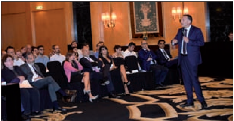
خلال إطلاق البرنامج في فندق فورسيزنز

وأشار إلى «إضافة فحوصات جديدة لم تكن تحصل في السابق للمعادن الثقيلة، كما تمّ الاتفاق على طرق الفحص سريع جداً». ولفت إلى وضع «شروط للتخزين والنقل مع إعطاء دور لوزارة الصحة في تحديد هذه الشروط». وأوضح أنّ «فئة حاجة إلى مسبار لفحص القمح الموجود في قعر السفن المحملة به، إذ يجب عدم الاكتفاء بفحص القمح الموجود على سطح السفينة، لأنّ القمح الموجود في القعر هو الأكثر عرضة للرطوبة والتلف». وختم ملامن أنّ «تكون هذه الإجراءات الجديدة قد وضعت ضوابط تضمن سلامة القمح والرغيف وسلامة المواطن اللبناني».