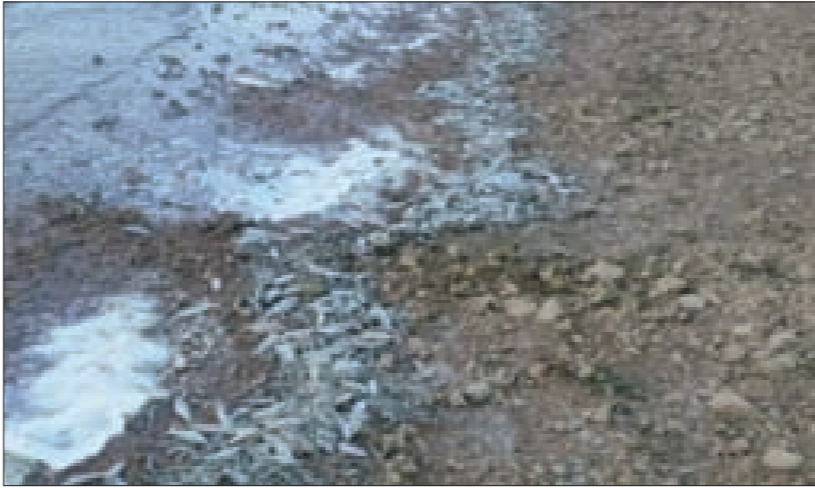
الاسماك النافقة على ضفة بحيرة القرعون

يغزو البحيرة واليوم نتفاجأ بنفوق الأسماك وبكميات كبيرة، خاصة أنّ المنطقة باكملها تعتمد على سمك البحيرة، لكنّ الأهم رفع التلوث نهائياً عن البحيرة». أما أصحاب المؤسسات السياحية على ضفتي البحيرة في عنتبتين وصغيين وباب مارع والقرعون ومشغرة، فأملوا «بأن يكون الموسم السياحي القادم مليئاً بالخير، وأن تتعزّز السياحة الداخلية إلى هذه المنطقة». وتعاونوا على وزارة السياحة «أن يكون لها لمسة كريمة بالإطلاع على أحوال هذه المراكز السياحية والعمل على تحقيق مطالبهم». فجأة ظهرت على ضفة بحيرة القرعون كميات كبيرة من الأسماك النافقة بكل الأحجام، حيث كشف عملية النفوق مكتب جهاز أمن الدولة في البقاع الغربي، الذي أخذ عينات منها وأبلغ فوراً وزارة الصحة التي أرسلت، بدورها، خبراء لأخذ عينات وفحصها وتشكف ملاسباتها. ويقول معنيون إنها المرة الأولى التي تنفق فيها أسماك بهذا الحجم في بحيرة القرعون. ووفق مصادر خاصة لـ«البناء»، تشير