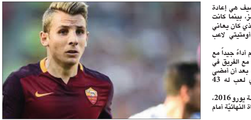
Portrait of Lucas Digne.

أعلن نادي برشلونة الإسباني عبر موقعه الرسمي عن تعاقد مع اللاعب الفرنسي لوكاس دين، لاعب نادي باريس سان جيرمان، والذي كان مُعآرا الموسم الماضي إلى نادي روما الإيطالي. ويأتي ذلك في خطوة مهمّة من المدرّب الإسباني لويس إنريكي من أجل تدعيم الخط الخلفي للفريق، وخصوصاً مركز الظهر الأيسر الذي يعاني الموسم الماضي من تواجد جوردو ألبا فقط. تعدّ تلك الصفقة هي الثالثة للمعلق الكتالوني هذا الصيف، الذي يرغب في تعزيز صفوفه كاملة من أجل العودة للفوز بالبطولة الأوروبية الموسم المقبل بعد أن كان حامل اللقب، وتوّج بها غريمه ريال مدريد في الموسم الأخير.