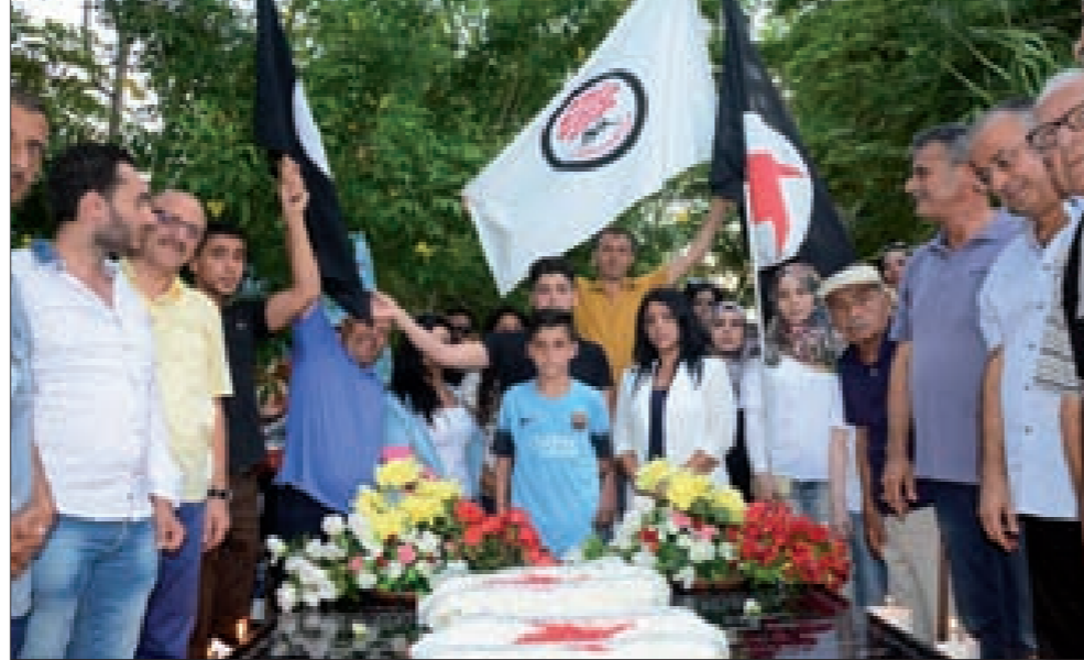
المشاركون أمام ضريحي الشهيدين