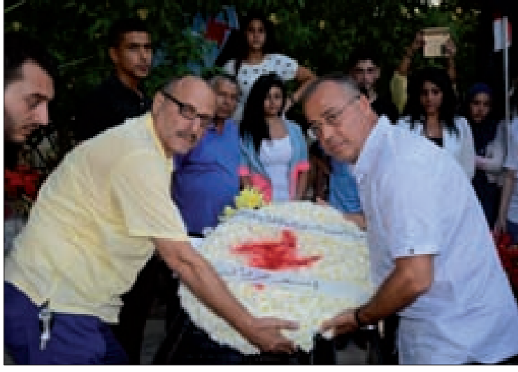
إكليل باسم الرئيس حردان