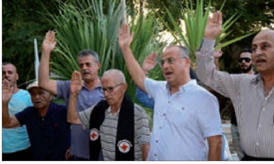
والد الشهيدين وعدد من الرفقاء يؤدون التحية لهما

وتابع: «ناتى اليك... نحييكما بتحية حزينا، نضع على ضريحكما الورود، نخبركما، بأنّ الحزب ما زال على نهج الصراع ويقدم الشهيد تلو الشهيد في مواجهة العدو اليهودي وفي مواجهة قوى الإرهاب والتطرف».