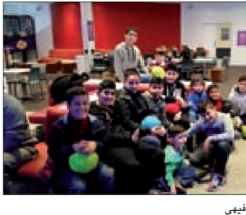
الأشبال في اليوم الترفيهي