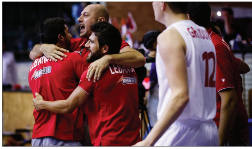
الياباني، وبعد غد الأربعاء ضد أصحاب الأرض الفريق الإيراني (16.30). على أن يتأهل إلى الدور ربع النهائي، الذي سينطلق يوم الجمعة المقبل، المنتخبات الثمانية التي تحتل المراكز