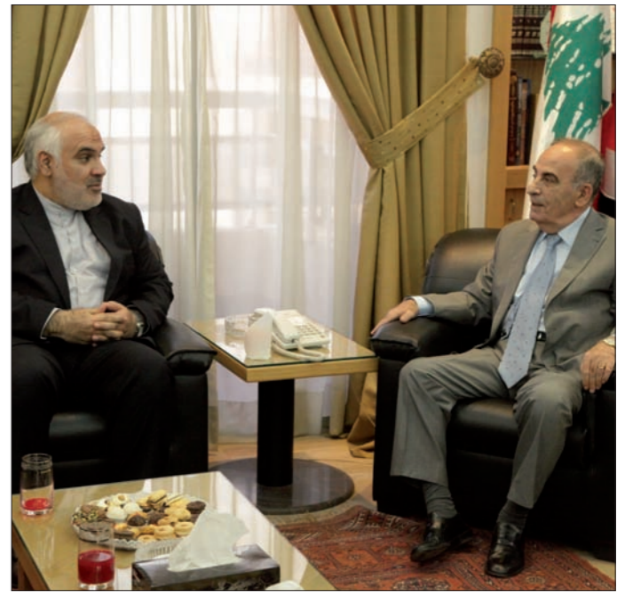
قانصو مستقبلاً فتحلي أمس

تحدثت المعارك الضارية التي تشهدها منطقة الحسكة شرق سورية عن حجم التحولات التي أدخلها مشروع التموضع التركي في الحرب السورية، حيث بدأت الميليشيات الكردية محاولة بناء منطقة سيطرة مؤشوقة، خشية التحولات المقبلة فهاجمت مواقع الجيش الحسكة، مستقوية بدعم التحالف الذي تقوده واشنطن، وبتورط أميركي بنشر وحدات عسكرية في مناطق سيطرة الميليشيات الكردية، يلزم واشنطن بالتحويل إلى طرف في المواجهات، سياسياً ودبلوماسياً لاحتواء تداعياته، (النتمة ص6)