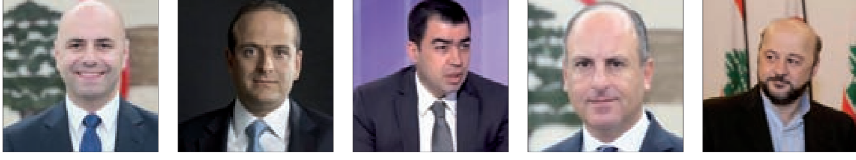
حاصباني رائد خوري أبي خليل بو عاصي رياشي

وأول سيدة محجبة تدخل الحكومة في لبنان، ومن نصيب قوة سياسية لم تصنف تقليدياً بين الأحزاب العلمانية التي دعت باستمرار لتمثيل المرأة وإنصافها في الحكومات وتشكيلاتها، وكان رئيس الحكومة سعد الحريري قد بشر بكونها نسائية في قانون للانتخابات يعتمد النسبية، وأصرّ على مفاجأة اللبنانيين باستحداث وزارة لشؤون المرأة في حكومته الأولى بعد غياب، لكنه لسبب غير معلوم لم يوفق بإنسانها لإمرأة، فتولاها رجل هو الوزير جان أوغاسبيان.