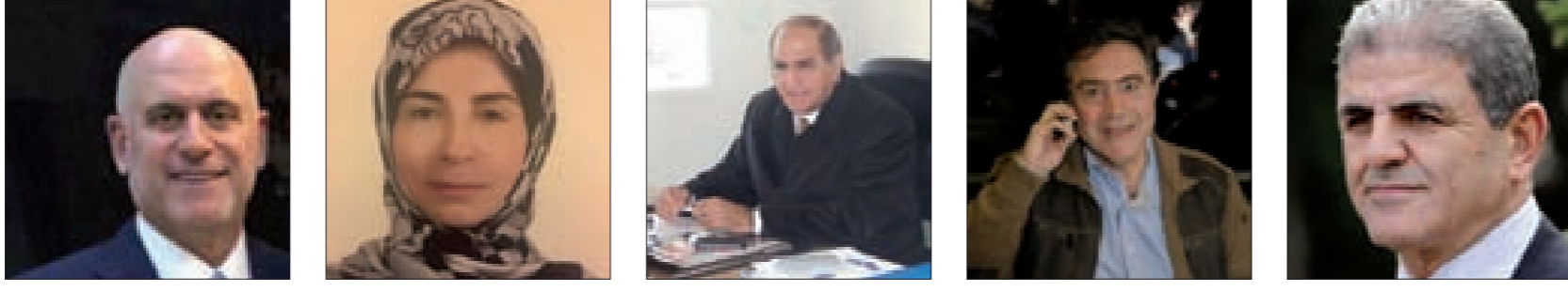
فنيانوس د. عنابة عز الدين الخطيب تويني رفول