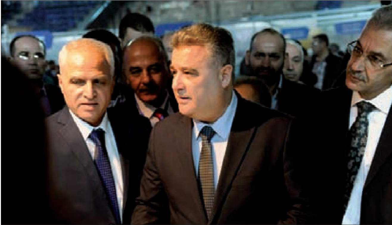
ترجمان مفتتحاً المعرض في صالة الجلاء