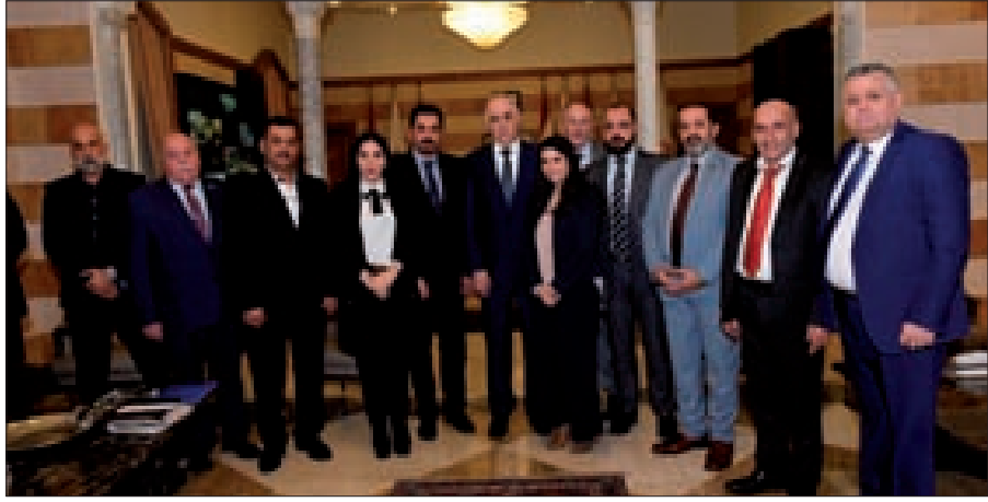
وزير الداخلية متوسلاً وفد مجلس الأعمال اللبناني الصيني