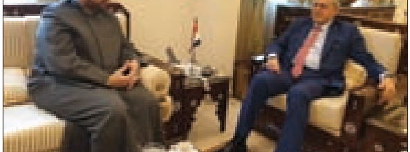
سفير سورية مستقبلاً القطان

وتشار إلى أنّ «العلاقات بين لبنان وسورية هي علاقات أخوة ومحبة»، داعياً إلى تسهيلات بين الجانبين لخير لبنان وسورية.