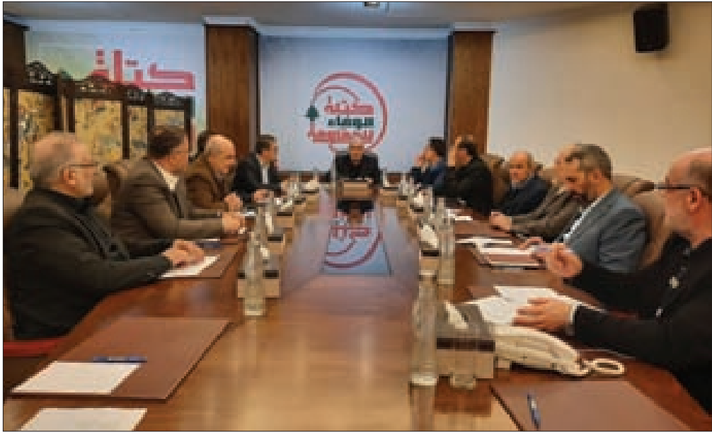
كتلة الوفاء للمقاومة مجتمعة في مقرها برئاسة رعد

وإذ هنأت الكتلة سورية قياداً وجيشاً وشعباً «على الإنجازات الميدانية النوعية ضد الإرهاب التكفيري وعصاباته في ريف وشمال حلب وغربها وتأمين الطريق الدولي فيها وعبرها، وإعادة تشغيل مطارها، وإعلانها مدينة آمنة».