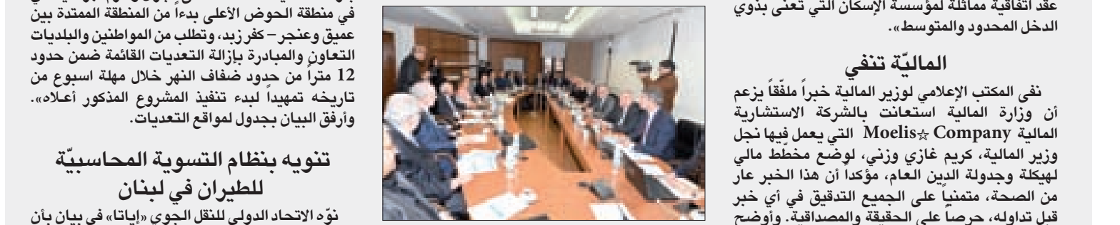
نحاس مترسداً اجتماع اللجنة الفرعية المنبثقة عن اللجان المشتركة

Lazard - Rothschild- Gueenheim - Houlihan Lokey- Citibank - PJT Partners- JP Morgan- Newstart Partners- Standard Chartered-- GSA Partners Deutche Bank- White Oak