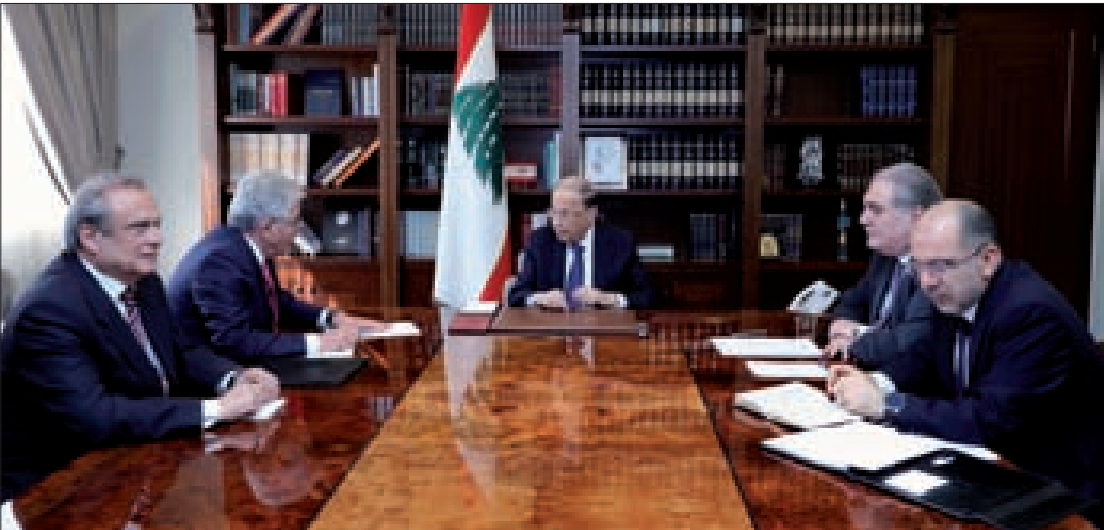
رئيس الجمهورية مستقبلاً صفير أمس

واستقبل عون سفير لبنان لدى واشنطن غايي عيسى وبحث معه في العلاقات اللبنانية – الأميركية وسبل تطويرها في المجالات كافة.