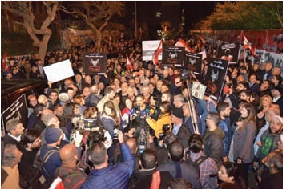
تظاهرة التيار الوطني الحر أمام مصرف لبنان أمس

وقع إشكال أمس بين مناصري التيار الوطني الحرّ من جهة ومناصري الحزب التقدمي الاشتراكي من جهة أخرى، في محلّة كليمنصو تخلله تراشق بالحجارة والعبوات البلاستيكية والزجاجية ما استدعى تدخل الجيش للفصل بين الطرفين لإعادة الهدوء إلى المنطقة.