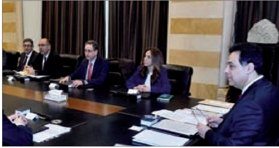
وفد صندوق النقد في السراي

باشر وفد صندوق النقد الدولي برئاسة رئيس البعثة مارتن سيريزولة جولته على المسؤولين المعنيين باستحقاق سندات اليوروبوند، فتوجه في يومه الأول بعد وصوله ليل أول أمس، إلى لبنان، إلى السراي الحكومي في التاسعة صباحاً، حيث شارك في اجتماع ترأسه رئيس مجلس الوزراء حسان دياب وضمّ الوفد إلى سيريزولة، ممثل مكتب المدير التنفيذي سامي جرع، والخبراء الاقتصاديين توم بيست، فرنتو ريكا ونجلا نخله، بحضور نائب رئيس مجلس وزير الدفاع زينة عكر عدرة، وزير المال غازي وزني، وزير الاقتصاد والتجارة راؤول نجعم، وزير العدل ماري كلود نجيم، مدير عام القصر الجمهوري انتوان شفيق، الأمين العام لمجلس الوزراء محمود مكّي، ومستشار رئيس الحكومة خضر طالب. وبعد الاجتماع أوضح وزني في دردشة مع الصحفيين، أنّ «هذا الاجتماع خصّص للتعرف»، مشيراً إلى أنّ «لبنان أعد خطة لمواجهة الأزمة وكيفية الخروج منها»، لافتاً إلى أنّ «صندوق النقد يعطي وجهة