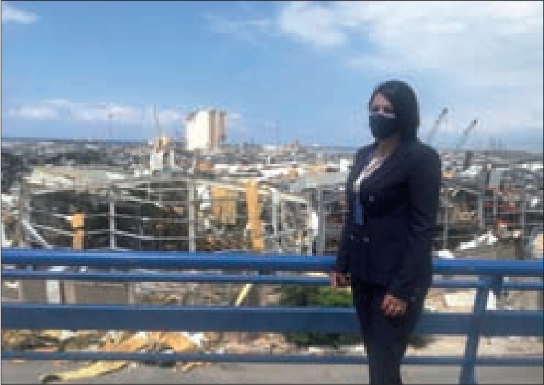
..وخلال زيارتها إلى منطقة المرفأ