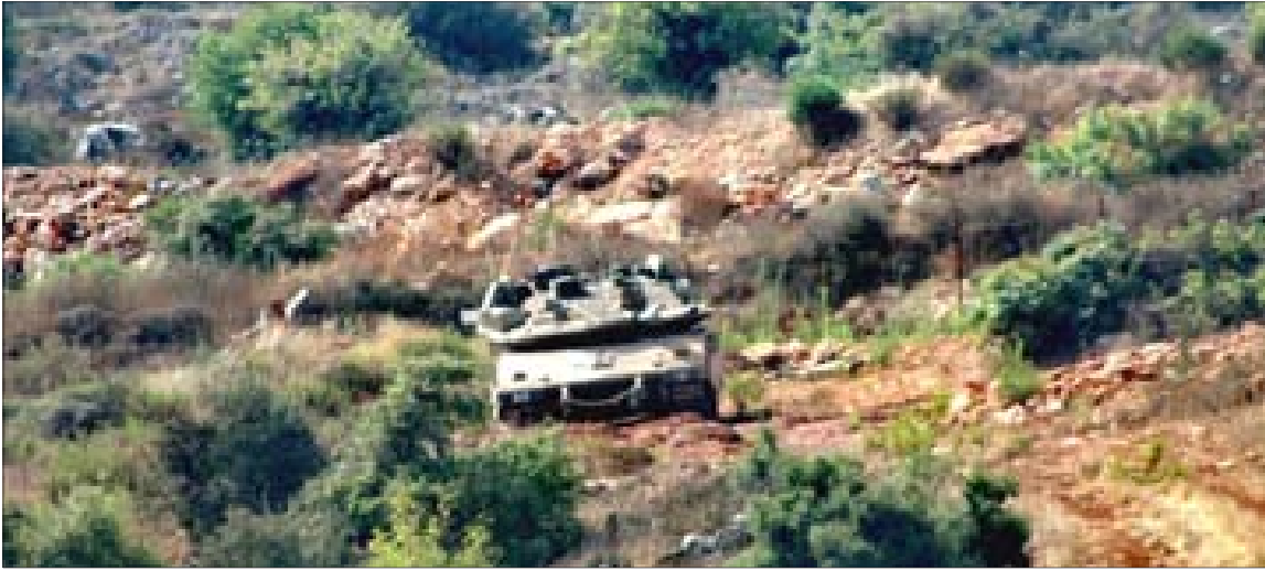
الدبابات الإسرائيلية بعد خروجها من المخبأ

خرقت أمس ثلاث دبابات «إسرائيلية» من نوع «ميركافا» السياج التقني في منطقة «كروم الشرقي» عند الخط الأزرق شرقي ميس الجبل.