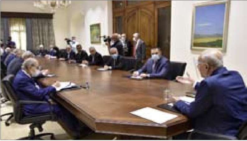
بري متشرساً اجتماع كتلة التحرير والتنمية

والمعاون السياسي لرئيس مجلس النواب النائب علي حسن خليل.