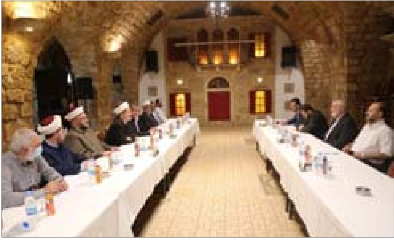
هنية مجتمعاً إلى الوفد أمس