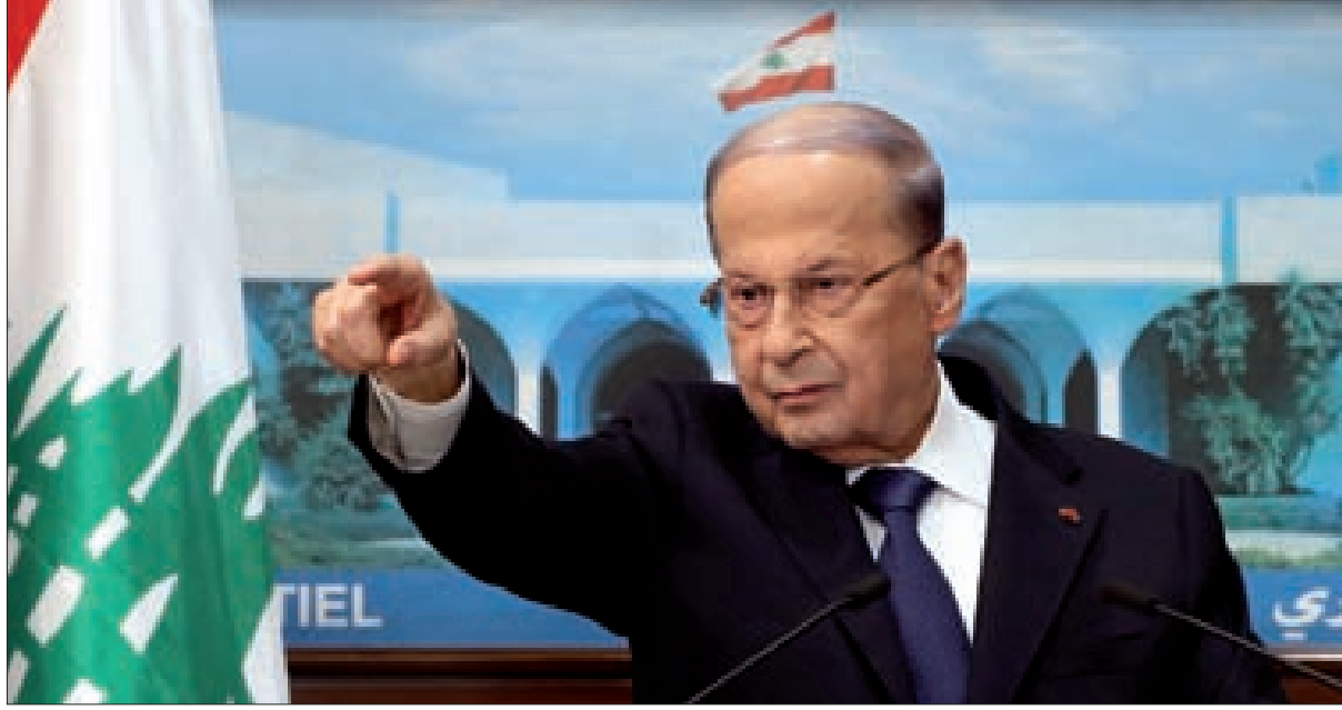
الرئيس عون خلال مؤتمره الصحفي في بعداً أمس

بالتوازي مع اتضاح صورة موقف الرئيس المكلف تبلورت صورة موقف رئيس الجمهورية العماد ميشال عون، بالتوضيح في منطقة وسط من التجاذب الحاد حول الصيغة الحكومية. ففي بيان وجهه رئيس الجمهورية، وصف الأزمة كحصولها لثلاثة مواقف حملها مسؤولية الفشل الحكومي، الأول هو سلوك الرئيس المكلف بعدم الانفتاح على الكتل النيابية واحترام حقوقها بالتمثيل في الحكومة، والثاني أداء رؤساء الحكومات السابقين الذي تصرف كمرجعية سياسية لحكومة أراد من الآخرين التسليم بحيادها السياسي، والثالث تمسك الثنائي حركة أمل وحزب الله، بحقبة المال، التي رفض رئيس الجمهورية اعتبارها طلباً ميثاقياً أو حقاً مكتسباً، رافعا عن المطلب تغطيته الرئاسية المتوقعة. (التمتعة ص8)