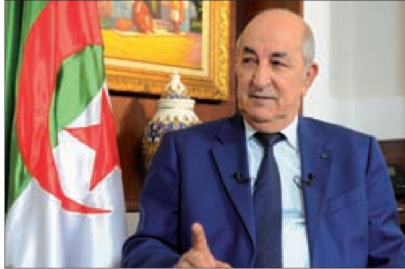
الرئيس الجزائري عبد المجيد تبون

وكانت الإمارات والبحرين وقعتا في البيت الأبيض، على اتفاق التطبيع الأسرلة» مع تل أبيب في واشنطن، بحضور الرئيس الأميركي دونالد ترامب.