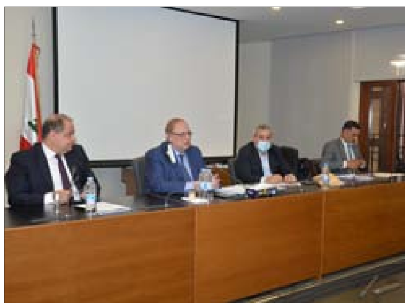
البستاني مترشساً اجتماع لجنة الاقتصاد

وتابع «تناول البحث دعم المحروقات والمواد الغذائية والكهرباء، وأكد المجلس الاقتصادي والاجتماعي أنه لا يمكن رفع الدعم ولكن يجب ترشيده لأننا اليوم ندعم الميسور والاجنبي والتهريب، وهذا موضوع فيه تدخل اجتماعي وسياسي، وهدفنا أن ندعم الفقير الذي لا تسع له أوضاعه بان يشتري بأسعار أعلى هذه هي السوق». ولفت إلى أن «تقدير مستويات الفقر عمل صعب وغيرنا قد جربها من الجيش إلى الشؤون الاجتماعية ومؤسسات أخرى. وهذا نقاش طويل ونحن لا نملك الوقت له وعلينا أن نجد ما هو سريع خصوصاً أننا مقبلون على موسم أعياد اليوم متطلبات الشعب قضية مهمة بالنسبة إلى اللجنة». وأضاف «في ظل غياب الحكومة، فإن دور لجنة الاقتصاد محوري، نحن نطالب بحقوق الشعب، وأريد أن أقول أمراً يتعلق بموعد طلبته اللجنة من حاكم مصرف لبنان رياض سلامة لأننا سنناقش معه دعم السلع والموال الطالب. وبلاסף، لم نتمكن اللجنة من تحديد هذا الموعد مع سلامة، وهذا أمر مؤسف».