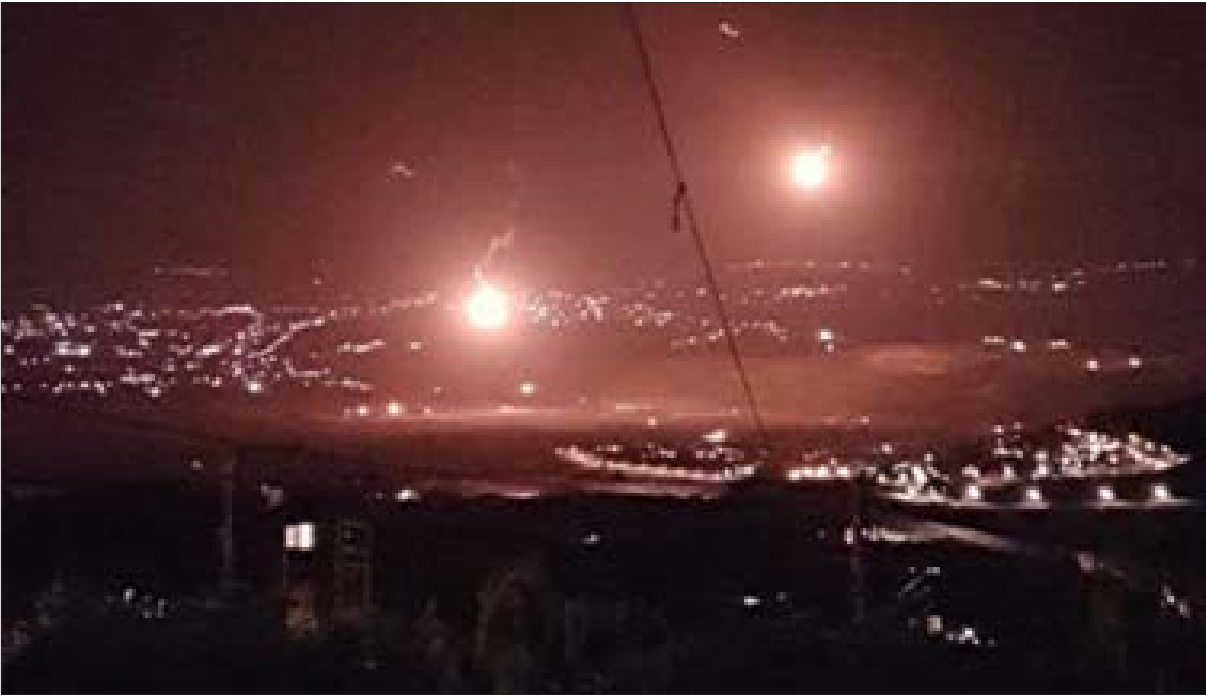
العدو الخائف يطلق القنابل المضيئة في أجواء مستعمرة المطة (علي شعيب)

مجموعة إرهابية تمارس أعمال الشغب عبر البحر بطريقة غير شرعية، تخللها عمليات تسلل الغطاسين وإخلاء الرهائن والجرحى بواسطة الطوافات.