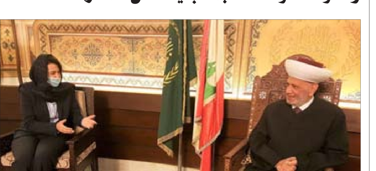
دريان مستقبلاً سفيرة فرنسا

استقبل مفتي الجمهورية الشيخ عبد اللطيف دريان، في دار الفتوى، سفيرة فرنسا آن غريو في زيارة بروتوكولية، بعد استلام مهامها الدبلوماسية الجديدة في لبنان.