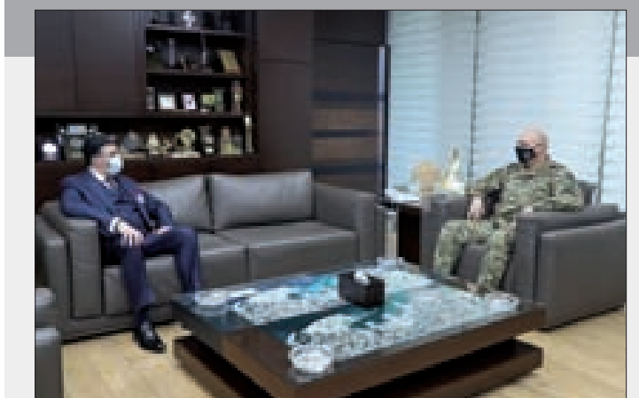
قائد الجيش مستقبلاً سفير لبنان في الأرجنتين في البرزة أمس

التي درج على اتخاذها. كما استقبل سفير اليابان تاكاشي أوكوبو الذي شكر لبنان على تأييده المرشح الياباني لمحكمة العدل الدولية وعلى مواقف أجرى في الأمم المتحدة كان لبنان مؤيداً لها، كما جرى