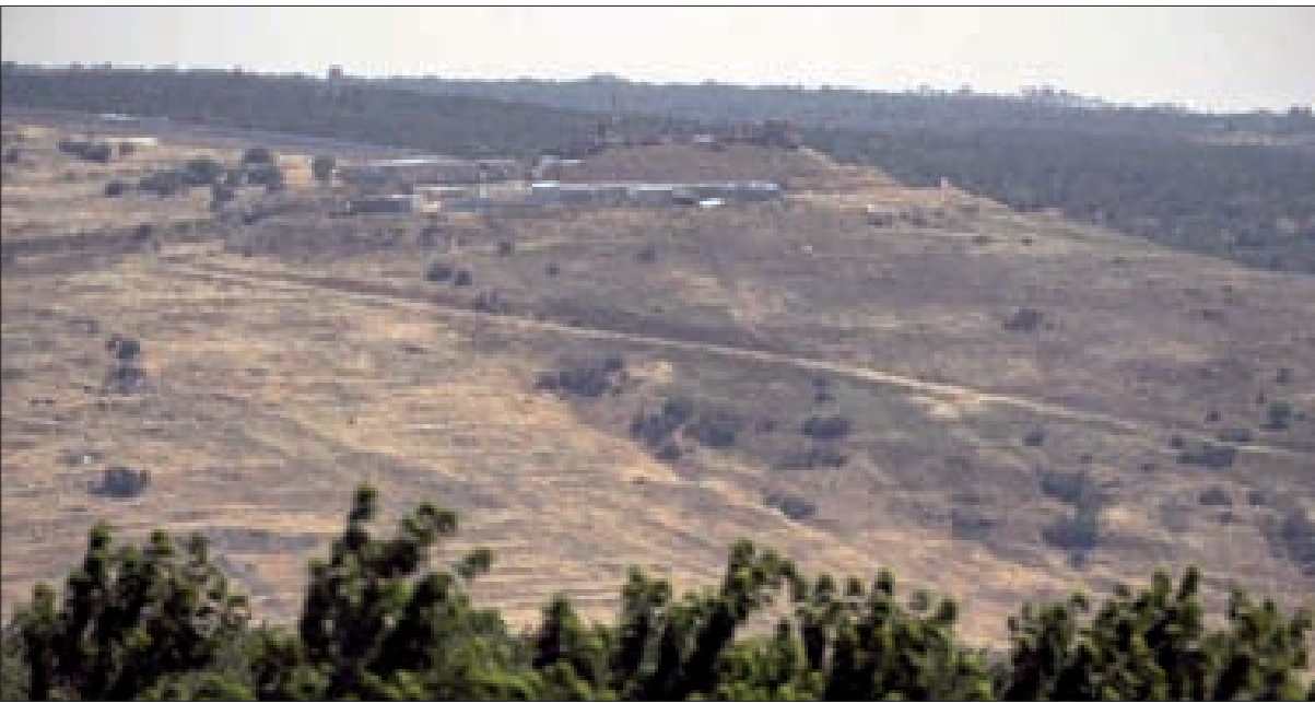
الجولان سوري وسيبقى... شاء من شاء وأبى من أبى

في ظل التخبط الأميركي في المنطقة بعد سقوط فقاغات الحديث عن الحرب، والعجز عن تأمين تسويات سياسية تواكب أي قرار جدي بالانسحاب، تقدم جيش الاحتلال إلى الواجهة للمشاغلة الأمنية بتوصيات وزير الخارجية الأميركية مايك بومبيو، فتحرّكت جبهتا جنوب لبنان والجولان بعمليات متفائلة المسارات بين قصف استهدف مواقع عسكرية سورية على حدود الجولان، وإلقاء القنابل المضيقية والقصف المدفعي في المناطق المتاخمة للحدود في جنوب لبنان، وهو ما وضعته مصادر في محور المقاومة في دائرة الحرب النفسانية للإيحاء بالقدرة على تغيير الموازين والتلويح بإمكانية شن حرب، بينما الإسرائيلي محكوم بمعادلات ردع تفوق قدرته على التورط بما يتخطى حدود العمل التكتيكي. وقالت المصادر إن جهوزية قوى المقاومة والجيش السوري عالية لمتابعة التطورات، والتعامل مع أي فرضية تصعيد تسعى لتغيير المعادلات والتوازنات. الوضع الإقليمي والدولي الذي يبدو متقدماً إلى الصف الأول من الأحداث على حساب الأوضاع المحلية، بدأ يتحول إلى تفسير وحيد للجمود المسيطر على المسار الحكومي، حيث الأسباب المحلية أمام مخاطر الفضل في ولادة حكومة جديدة،