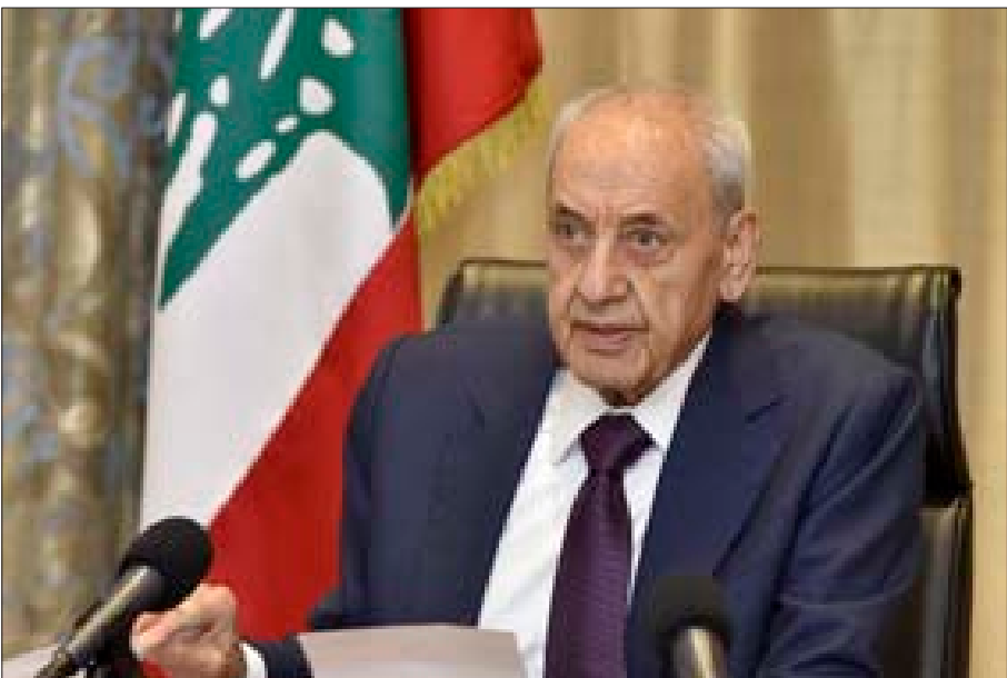
بری یلقى كلمته عبر الفیدوی أمام المؤتمر البرلمانی الدولي لدعم الانتفاضة الفلسطينية المنعقد في طهران (حسن ابراهیم)

سلام لفلسطين .. لشهدائنا وشهدانكم وشهداء فلسطين والحرية للراسرى».