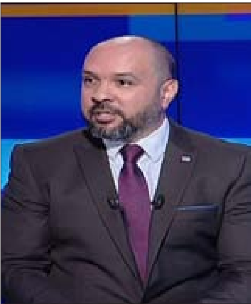
السفير الكسندر موراغا

وختم عبيد بالقول: إننا إذ نشدد على ضرورة احترام سيادة الدول وإرادة شعوبها، نؤكد تضامناً الكامل مع جمهورية كوبا، وندين بشدة الإجراءات ضدها، ونرفض المعايير التي تضعها الإدارة الأميركية، لتصنيف الإرهاب. لأنّ الإرهاب الحقيقي يتجسد بالاحتلال والعنصرية والتطرف وداعيمه.