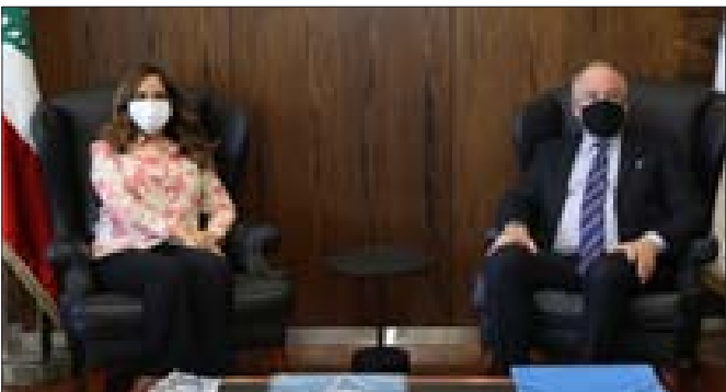
عكر مستقبلة قائد اليونيفيل في البرزة أسس

وأثنت على الجهود التي قامت وتقوم بها قوات «يونيفيل» بالتعاون والتنسيق مع الجيش اللبناني لمعالجة هذه الأمور. وخلال اللقاء جرى البحث أيضاً