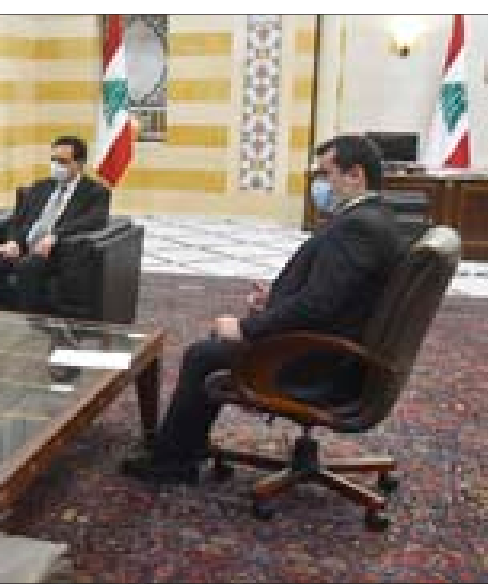
دياب مستقبلاً السفير المصري في السراي أسس

وألغى وزير الصحة السابق محمد جواد خليفة، من «أننا في مازق والوضع صعب. وليس لدينا سوى التقيد بالإجراءات المطلوبة والتزام المعايير الصحية». ولفت إلى أن «الكارمل يعودوا هم الأكثر تضررا من كورونا حيث أن الفيروس يات يظهر على الفئات الشابة أيضا»، شارحاً أن «العوارض تزيد».