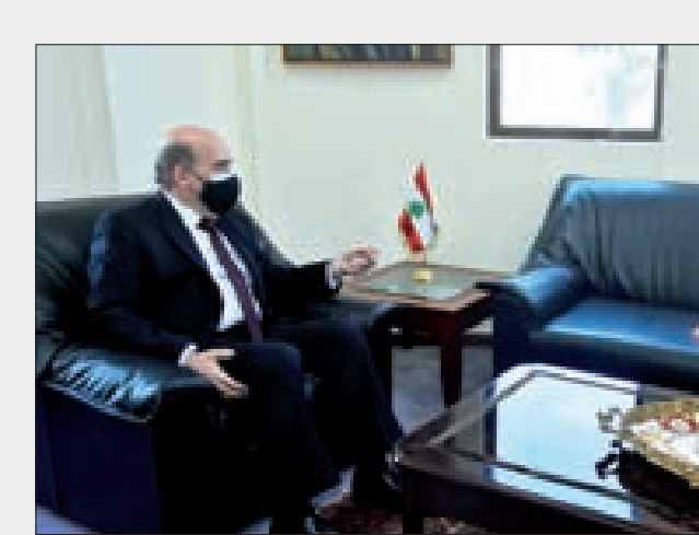
وهبة وسفير الكويت خلال لقاءهما أمس

وقال بخاري«إن موقف المملكة العربية السعودية، يشدّد على التزام المملكة بسيادة لبنان واستقلاله ووحدة أراضيه، خصوصا على ضرورة الإسراع في تأليف حكومة قادرة على تحقيق ما يتطلع إليه الشعب اللبناني».