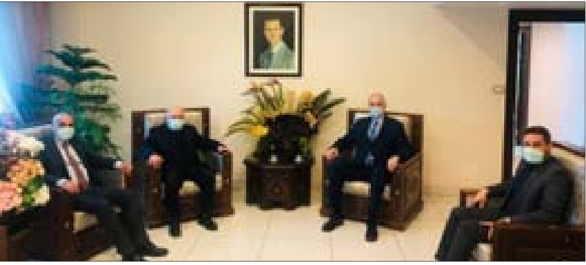
الجعفري مستقبلاً الوفد القومي

والأكاذيب، وفاضحاً تورط الدول الغربية وعلى رأسها الولايات المتحدة الأمريكية في دعم الإرهاب والتطرف، ورعاية الحرب الكونية على سورية. وأكد الوفد أنّ سورية صمدت وانتصرت بشجاعة وحكمة الرئيس السوري وبالقرار الحاسم بالمواجهة وبإدعاء وتماسك القيادة السياسية والدبلوماسية وبمسالة الجيش السوري وتضحياته ويصمود الشعب، ما شكل عناصر قوة حاسمة في المواجهة التي خاضتها سورية ضد الإرهاب ورعاته الدوليين والإقليميين وبعض العرب.