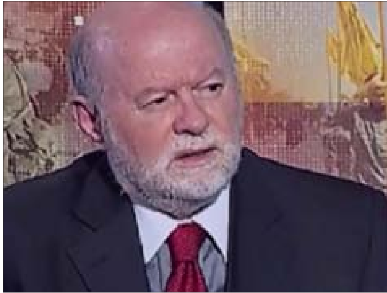
المناضل الراحل أنيس النقاش

الكبير وأحرار العالم»، والبرق الرئيسي الدكتور سليم الحص إلى عائلة النقاش واحداً من ريعيل المفكرين الشرفاء الذين ما فتئوا يواظبون السعي لتوحيد قدرات هذه الأمة المجيدة في سبيل تحرير فلسطين من احتلال العدو الإسرائيلي» وأضاف «بوفاته خسرنا فلسطين الفئائي والمناضل والمكافح والواثق بتحريرها وهو الذي أقسم على القرآن والمسدد لتحرير فلسطين من النهر إلى البحر، وهو الذي وهب حياته وفكره للقضية فكان المفكر بآفةً وبعرة نفس وكرامة تآبى الهوان، وكان المقاوم المقدم المدافع عن الهوية وعن الأرض العربية وخير مجاهد على طريق الجهاد المقدس في سبيل تحقيق تحرير فلسطين وكل الأرض العربية من برائن الاحتلال الإسرائيلي».