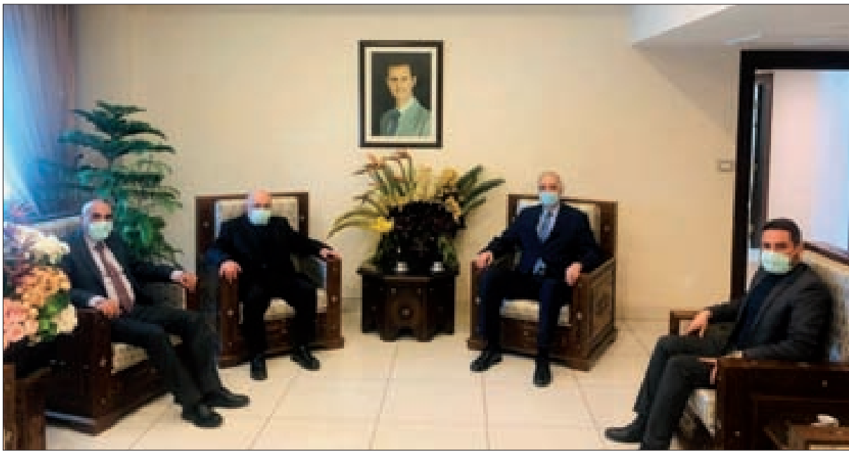
الجعفري مجتمعاً إلى الوفد القومي في دمشق

لبنانيا، تستعدّ بيروت لتشجيع المناضل الأممي والمفكر العربي أنيس النقاش بعد ظهر اليوم، بحيث يشارك الأهل والأصدقاء وعدد من الشخصيات السياسية في تشجيع رمزي فرضته ظروف مواجهة كورونا، بعدما تحوّل رحيل النقاش إلى حدث لبناني وعربي ودولي فكانت برقية تعزية معبرة من الرئيس السوري بشار الأسد، وأخرى من مكتب مرشد الجمهورية الإسلامية الإمام علي الخامنئي، (التمتة ص6)