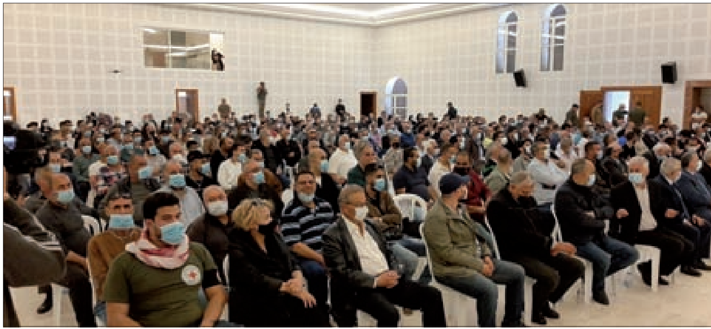
جانب من الاجتماع الإداري في ضهور الشوير لهيئات التنفيذ والمسؤولين الإداريين لـ القومي في لبنان

كتب المحرّر السياسي علّق مصدر سياسي متابع لمفاعيل الانهيار الذي يفرض حضوره كخطر داهم، أن زيارة رئيس حكومة تصريف الأعمال حسان دياب إلى قطر، تشكل العمل الوحيد الذي يقوم به المسؤولون السياسيون في محاولة تأخير الانهيار، فالمبادرات السياسية الهادفة لتحريك المسار الحكومي تعطلت، ولا أفق لتحركها مجدداً، والزيارات الخارجية التي يقوم بها الأطراف بما فيها جولات الرئيس المكلف بتشكيل الحكومة سعد الحريري، تظهر للقوة السياسية في سياق التجاذب الداخلي، وإن كانت لحشد الدعم للبنان فهي لن تأتي بنتائج قبل تشكيل حكومة لا تبدو الجهود لتذليل العقبات من طريق ولادتها، ترجمة للثقة بحجم الدعم الذي يجري الحديث عنه لما بعدها، ويضع المصدر زيارة الحريري إلى الفاتيكان كما زيارة النائب جبران باسيل كرئيس للتيار الوطني الحر إلى موسكو في سياق شرح المواقف، وإثبات عدم المسؤولية عن الأزمة الحكومية. الرئيس دياب الذي التقى بأمير قطر تميم بن حمد