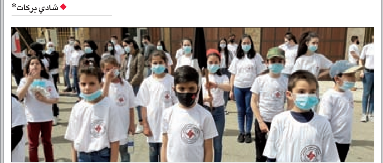
أخاطب أجيالاً لم تولد بعد...