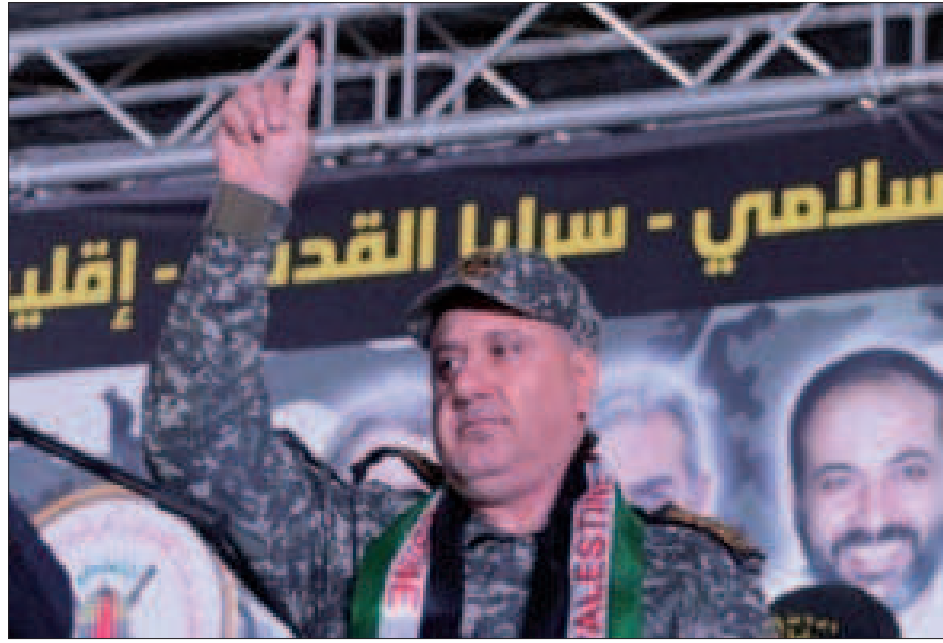
القيادي البارز في سرايا القدس الشهيد تيسير الجبري

دون مقدمات عسكرية أطلقت حكومة الاحتلال عدواناً عسكرياً على غزة، وصفته بالعملية العسكرية التي تستهدف حركة الجهاد الإسلامي في فلسطين، بعد حملة استهداف للحركة في الضفة الغربية، وترجم جيش الاحتلال العملية بغارات شملت أنحاء قطاع غزة، تم خلالها اغتيال القائد البارز في سرايا القدس تيسير الجبري، واستهداف عدد من المواقع التابعة للسرايا وحركة الجهاد، ورافقت الحملة بيانات سياسية واضحة في السعي للحصر العملية باستهداف الجهاد، ودعوة حركة حماس للبقاء على الحيا، مع تنشيط دور الوسيط المصري والضغط القطري والتركي لدفع حماس وترقب نتائج المواجهة لأيام، قبل أن تقرّر المشاركة، مع رهان إسرائيلي على النجاح بالتخلص من الجهاد خلالها، والاستعداد للتوصل إلى تفاهات مع حماس حول الحصار على غزة، وقالت مصادر متابعة لمجريات الحرب الإسرائيلية الجديدة، إن الحرب التي تشنها قوات الاحتلال تستعيد أجواء حرب تموز 2006 التي سعت لسحق حزب الله، بهدف خلق توازنات جديدة على جبهة المواجهة مع لبنان، لكن بنية أميركية معلنة لبناء شرق أوسط جديد، عبر التوازنات الجديدة التي يفرضها التخلص من المقاومة في لبنان لو نجحت الحرب بتحقيق أهدافها، وانعكاس ذلك على التوازنات بوجه سورية وإيران، في تلك الفترة، أما اليوم فتقول المصادر إن أميركا وكيان الاحتلال في مآزق العجز عن خوض حرب بوجه دول وقوى محور المقاومة، والعجز عن تحمل