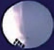
المنطاد الصيني في الأجواء الأميركية...!

في لبنان دعوة جاهزة لحكومة تصريف الأعمال تم توزيع جدول أعمالها لا يزال تحديد موعدها بانتظار ان يعطي حزب الله موافقته على الحضور، بينما قالت مصادر حكومية إن الحزب على موقفه الذي لا يمانع الحضور عندما تتضح ملفات تحتاج للبت بها إلى انعقاد الحكومة وتمثل حاجات حيوية للبنانيين. ومن هذا (التمتة ص6)