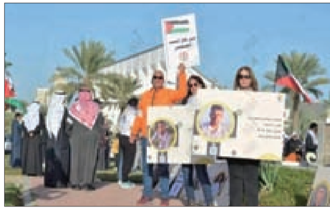
مشاركون في الوقفة يرفعون صور شهداء جنين

وأشاروا إلى أنّ التوافق الشعبي والموقف الرسمي منسجمان بتقديم كل أشكال الدعم للشعب الفلسطيني الشقيق والرفض القاطع لجرائم الكيان الصهيوني. ورفع المشاركون في الوقفة صور شهداء جنين الذين، منذ بداية العدوان الصهيوني المتواصل، بينما المجتمع الدولي يتفرّج.