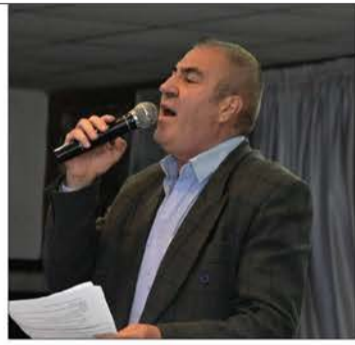
الشاعر القومي رياض سعادة