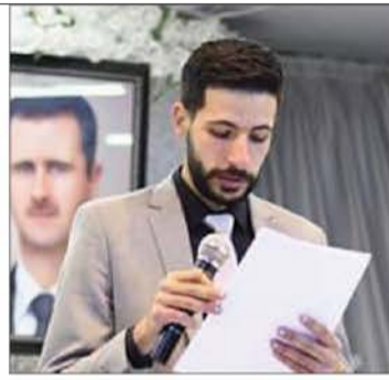
مفوض مفوضية منين محمد زرزور