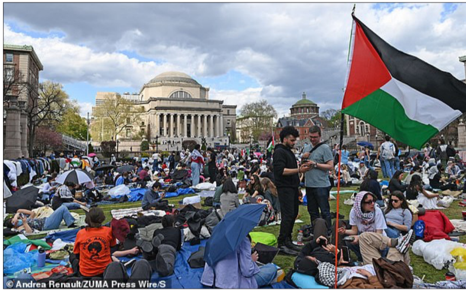
رغم القمع الوحشي... الاحتجاجات متواصلة في الجامعات الأميركية في ظل علم فلسطين