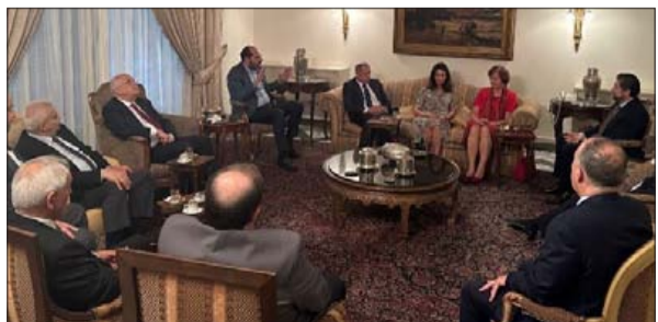
كتلة التوافق الوطني خلال اللقاء مع فرونتسكا أمس

كل الحث النيابية يدعو إليه الرئيس نبيه بري بصفته رئيس المؤسسة الدستورية الوحيدة المتبقية في لبنان على أن يكون هذا الحوار من دون شروط مسبقة».