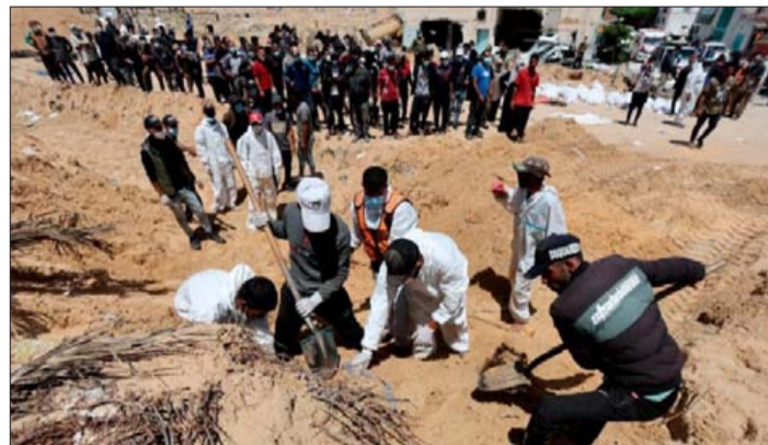
وطالب الدفاع المدني بتحقيق دولي في جرائم الاحتلال، مشيراً إلى أنه سيقدم كافة الأدلة للجهات الدولية.

أكد الدفاع المدني في غزة انتشار نحو 392 جثماً من 3 مقابر جماعية في ساحة مجمع ناصر بعد انسحاب الاحتلال منه، وذلك منذ بدء عمليات انتشار الجثامين قبل أسبوع. وأفاد الدفاع المدني، خلال مؤتمر صحفي أمس، بأن 58% من الجثامين المنتشلة لم يتم التعرف عليها، وأن هناك جثامين لأطفال بعضها مقطوع الأطراف، مستغرباً وجود جثامين لأطفال بالمقبرة الجماعية. ولفت إلى آثار تعذيب وجدت على جثث بعض الشهداء في المقبرة الجماعية بمستشفى ناصر، مضيفاً أن نحو 10 جثث كانت مكبلة الأطراف، كما أن المصل الطبي كان لا يزال معلقاً ببعض الجثث، ما يشير إلى إمكانية دفن الضحايا أحياء. وقال: «نعتقد أن قوات الاحتلال دفنت 20 شخصاً على الأقل بالمقبرة الجماعية وهم على قيد الحياة، مشيراً إلى أن الاحتلال دمر جميع مختبرات الطب الشرعي في القطاع، لذا لا يمكننا التأكد من ذلك».