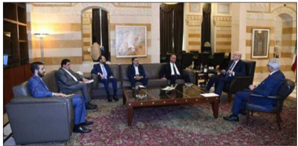
ميقاتي مجتمعاً إلى كتلة الاعتدال الوطني في السرايا أمس