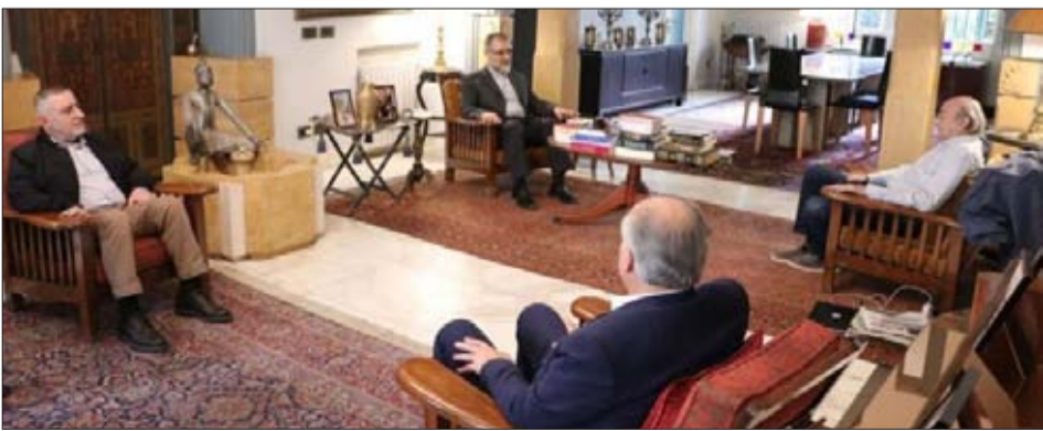
جنبلاط مستقبلاً وفد حزب الله في كليمنصو أمس

في الجنوب واستمرار العدوان الإسرائيلي على لبنان». كما جرى البحث في «أزمة النزوح السوري وكيفية الوصول إلى موقف لبناني موحد من هذه الأزمة». وكانت مناسبة لإطلاع وفد الحزب على «الورقة التي أعدها الحزب التقدمي الاشتراكي في هذا الخصوص وتتضمن أفكاراً عملية محدّدة ستعرض على مختلف القوى السياسية، اعتباراً من الأسبوع المقبل».