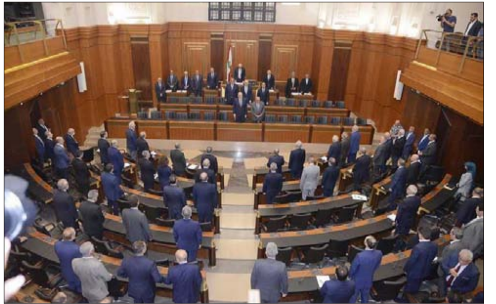
خلال افتتاح الجلسة التشريعية في ساحة النجمة أمس

عامل إضافي ولكن ليس هو السبب الأساسي. ولأن التمديد له سلبات وهو الترهل بالعمل البلدي، إذا استطعنا أن ندخل تعديلات في هذه الجلسة، فهناك بلديات منحلة ولنعمط المجال في القانون لأن تعود هذه البلديات عن استقلالها والبلديات التي يصف أعضائها لا يريدون أن يكملوا التجري لهم انتخابات. كما أن لدينا مجموعة أفكار حول موضوع الرسوم لتؤمن موارد إضافية للبلديات».