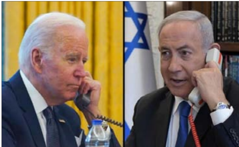
بايدن لتنتياهو... المحادثة انتهت... والكيان في مهب الهلع من الرد الإيراني

بنيامين نتنياهو، خلال محادثة هاتفية بينهما ليل أمس.