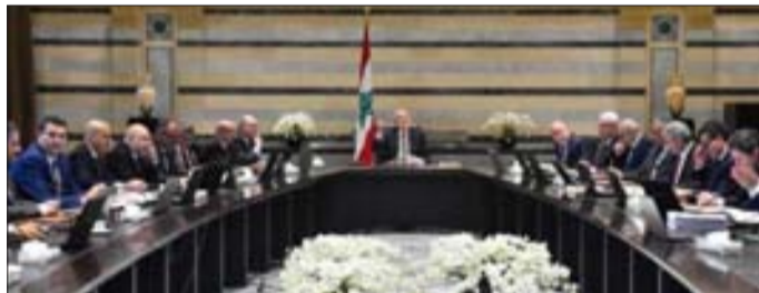
مجلس الوزراء مجتمعاً في السرايا أمس

أضاف «أما في ما يتعلق بمرسوم تحديد الهيئات الأكثر تمثيلاً فقد قدمته مراعاةً للمهمل القانونية التي نص عليها قانون التقاعد الصادر عن مجلس النواب، فأنا التزمت بالمهمل، ولكن بناءً على اتصالات أجريت فهناك الكثير من الهيئات طلبت تعديل هذا الموضوع. ولذا، أجلنا مشروع المرسوم لمزيد من الحوار في هذا المجال».