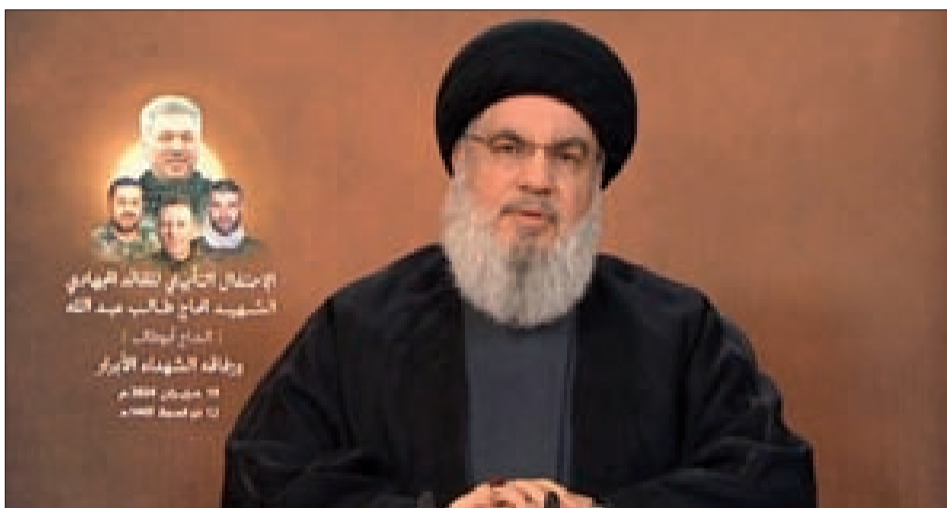
السيد نصرالله متحدثاً في الاحتفال التابيني التكريمي للقائد الشهيد طالب عبدالله ورفاقه

كتب المحرر السياسي اختار الأمين العام لحزب الله مناسبة تكريم الشهيد القيادي في المقاومة «أبو طالب» ومناسبة نشر التسجيل المصور للإعلام الحربي عن حصاد طائرات الهدهد التي صالت وجالت في الأجواء الفلسطينية المحتلة فرق حيفا وما بعد حيفا وما بعد ما بعد حيفا، كما قال السيد نصرالله، ليقدّم ما يمكن وصفه الانتقال إلى المرحلة الثانية من حرب الإسناد عبر جبهة لبنان، انطلاقاً من التخلي عن الحذر من خطر الانزلاق أو التدرج نحو الحرب الكبرى، والإعلان عن إكمال الجهوزية اللازمة لخوض غمارها إذا ارتكب الاحتلال الحمافة الكبرى بالذهاب إليها، مؤكداً أن كل جغرافيا فلسطين المحتلة ستكون مسرحاً لنيران المقاومة بأسلحتها الدقيقة، وأن كل منشآت الكيان التي تهدمت أسس بقائه سوف تكون ضمن بنك أهداف مليء ومحسوب بعناية لتحقيق الهدف، وهو سقوط الكيان.