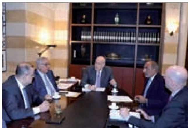
الاجتماع بشأن النازحين في السرايا أمس

ترأس رئيس الحكومة نجيب ميقاتي اجتماعاً، أمس في السرايا، لبحث موضوع النازحين السوريين، شارك فيه وزير الخارجية والمغتربين عبد الله بو حبيب، المدير العام للأمن العام بالإنابة اللواء إلياس البيسري، المنسّق المقيم للأمم المتحدة في لبنان عمران ريزا وممثل المفوضية السامية للأمم المتحدة لشؤون اللاجئين في لبنان إيفو فرايسن.