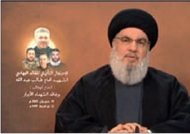
السيد نصرالله متحدًا في أسبوع الشهيد طالب عبدالله ورفاقه

وبقي 4 كتاب في رفح يعمل للقضاء عليها وهذا كذب يُظهر هشاشة العدو الذي يلهث لتقديم نصر وهمي لمستوطنيه»، موضحاً «أن جيش العدو خرج وقال إن المقاومة الفلسطينية استعدت عافيتها في كامل القطاع ما أطاح رواية نتنياهو». وأكد «أن هناك خسائر هائلة لحقت بكيان العدو بشرياً وإستراتيجياً ولن يستطیع إخفاء الأمر في نهاية المطاف فهناك 8636 معوقاً وفق إحصاءات رسمية، فكم عدد القتلى والجرحى؟».