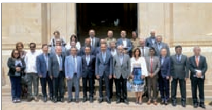
علامة وأعضاء اللجنة مع عدد من السفراء أمام المجلس النيابي أمس

قال بعد اللقاء «عرضت مع دولة الرئيس ميقاتي الأوضاع في الجنوب، والتقارير التي تردنا عن الأضرار جراء الاعتداءات الإسرائيلية، كما تابعنا موضوع الهبات المخصصة للنازحين من قرى المواجهة في الجنوب».