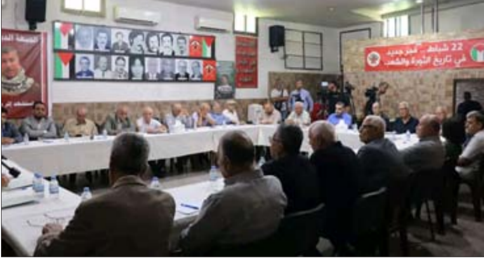
جانب من المشاركين في الورشة الحوارية

لتحمل المسؤولية إلى جانب مناضلين تاريخيين بذلوا سني حياتهم في سبيل فلسطين.