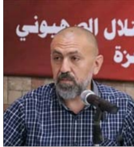
مهدي يلقي كلمته

وأشاد مهدي بضخ دفعة جديدة من الجيل الشاب