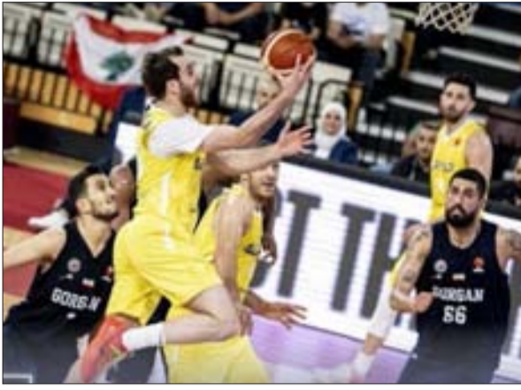
سيظفر صاحب المركز الثالث بين غورغان الإيراني والكويت بالبطاقة الثانية، التزاماً بقوانين البطولة.

وستلعب الفرق إجمالي ثلاث مباريات لكل منها في مرحلة المجموعات، على أن يتأهل أول فريقين في ترتيب كل مجموعة إلى الدور نصف النهائي، وخلاله سيلعب الفريقان الحاصلان على المركز الأول من المجموعة الأولى والثانية ضد الفريق صاحب المركز الثاني من المجموعة المقابلة، وستتوج الفائز في المباراة النهائية بطلاً لدوري أبطال آسيا ويحصل على حق تمثيل القارة في كأس القارات للعبة.