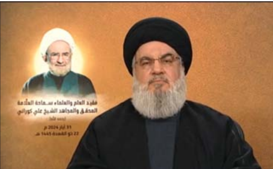
السيد نصرالله... معركة غزة وجودية وجبهة لبنان قوية وضاغطة