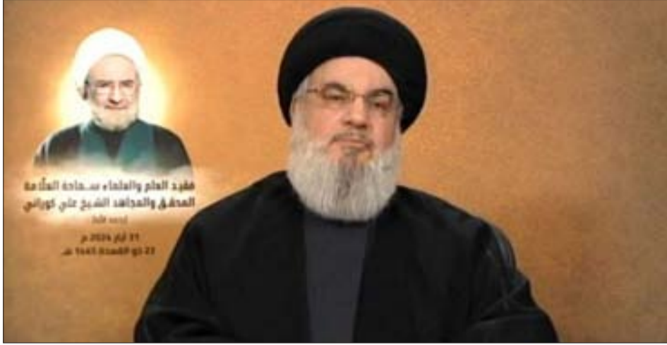
السيد نصرالله يتحدث عبر الشاشة أمس