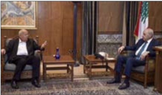
بري مستقبلاً حداثة في عين التينة أمس

المبعوث الفرنسي والمطالبة بإطلاق سراح جورج عبد الله»، مشيراً إلى أنّ الرئيس بري كان متجاوباً «واتفقنا على استكمال هذه الخطوة مع لجنة الشؤون الخارجية في مجلس النواب ومع رئيسها الدكتور فادي علامة ونواب آخرين».