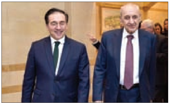
بري وسفير إسبانيا في عين التينة أمس

جال وزير خارجية إسبانيا خوسيه مانويل الفاريس والوفد المرافق على المسؤولين اللبنانيين، فالتقى رئيس الجمهورية جوزيف عون في القصر الجمهوري في بعثا.