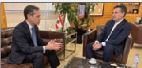
حمية مجتمعاً إلى سفير تركيا الجديد

مكتبه في الوزارة، مع سفيرة اليونان لدى لبنان ديسينا كوكولوبولو في العلاقات الثنائية بين البلدين ومشاريع مشتركة بين وزارة الإعلام وسفارة بلادها.