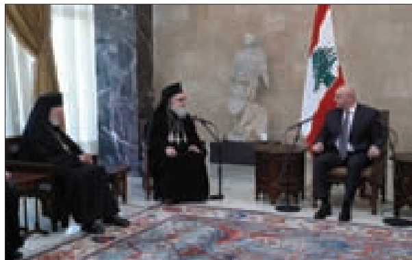
الرئيس عون مستقبلاً بطيريك يازجي في بعثا أمس

تصريف الأعمال موريس سليم الذي هنأه بانتخابه، وعرض معه الأوضاع العامة في البلاد وأوضاع المؤسسة العسكرية.