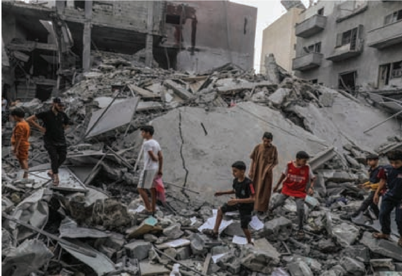
حجم الأذى والقتل والدمار في غزة سيخلق أجيالاً جديدة أكثر قسوة وقدرة على المقاومة

ولكن من يهّمهم الأمر في القاهرة والدوحة كما في واشنطن وتل أبيب من أصحاب فكرة أن لا مكان لحركة حماس في حكم غزة لا بل ولا مكان للمقاومة في غزة، يدركون مسألتين الأولى أن حجم الأذى والقتل والدم والدمار الذي حاق بغزة وأهلها من شأنه أن يخلق أجيالاً جديدة أكثر تطرفاً وقسوة وقدرة على الإيغال في الدم من مقاتلي حماس، وأن حركة حماس لا بد لها من دور في استيعابهم وإلا فإن هذا الفراغ لن تملأه إلا جهات تكفيرية أكثر تطرفاً. هذا ما تحاول الدوحة أن تعمل عليه باتجاهين الأول إقناع العالم بالفكرة والقدرة على تنفيذها، والثاني إقناع حركة حماس بأن هذه فرصتها الوحيدة والأخيرة للبقاء وإلا فإن رأسها مطلوب. بهذا تتأكد كل من الدوحة والقاهرة أن لا تكون حماس حاكمة في غزة، لذلك لا بد من وجود جهة من خارج صندوق المقاومة قادرة على أن تحكّم وأن تغيب أهل غزة وتعيد