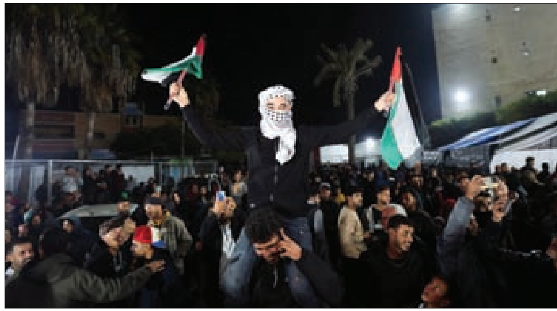
المقاومة تفرض شروطها والاحتفالات بالنصر وانتهاء الحرب تعمّ غزة

في غزة والضفة ومخيمات الشتات عمّت أعراس الفرح، وخصوصاً في غزة، حيث تحولت البهجة بالاتفاق إلى عرس وطني كبير، بينما دخل الكيان في حالة ارتباك تحت تأثير قلق أهالي الأسرى من تعرقل تنفيذ كامل مراحل الاتفاق، وتصدعت الحكومة مع تهديد ايتمار بن غفير لرئيس الحكومة بنيامين نتياهو