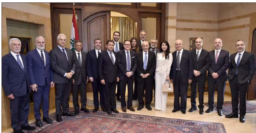
بري متوسلاً وفد الهيئة الإدارية الجديدة لجمعية التخصص والتوجيه العلمي

على النحو القائم حالياً. لقد أنّ الأوان للمجتمع الدولي وبعد التحولات التي حصلت في سورية أنّ يقارب المجتمع الدولي ومنظّماته هذا الملف في أسرع وقت ممكن بما يحفظ لبنان استقراره ويعيد التآزح إلى سورية». وقدم أعضاء الهيئة الإدارية الجديدة لرئيس المجلس لمحمة عن برنامج عمل الجمعية للمرحلة المقبلة. مؤكداً «أنّ الاطمئنان والثقة هي في الداخل اللبناني وبيد اللبنانيين». وأشار إلى «أنّ وتيرة العمل القائمة حالياً، سواء في إنجاز التعيينات التي بدأتها الحكومة وإعادة النبط للإدارة العامة حتماً ستؤدي إلى سلوك لبنان درب الخروج من أزمتها». وتطرّق الرئيس بري إلى ملف النازحين السوريين، وقال «لا يجوز أن يبقى هذا الملف