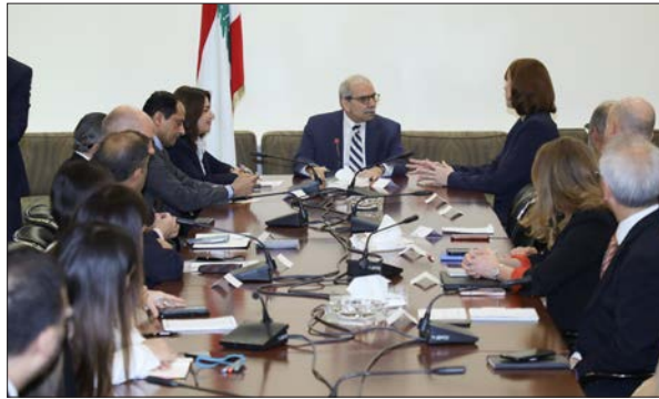
سلام مترأساً الاجتماع في السرايا أمس

بعدما، عرضت الوزيرة السيّد روية الوزارة لشبكات الأمان الاجتماعيّ التي تتمحور حول التوجهات الإستراتيجية الأربعة للاستراتيجية الوطنية للحماية الاجتماعية، وهي: توسيع الدعم النقديّ المباشر، تعزيز الروابط مع الخدمات الاجتماعية، بناء القدرات المؤسسية والبنية التحتية، وتعزيز التنسيق ومواءمة الأنظمة».