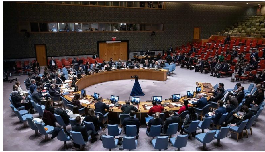
مجلس الأمن يدعو السلطات السورية المؤقتة إلى محاسبة مرتكبي عمليات القتل الجماعي

النظام الجديد مسؤولية ما جرى مطالباً بخطوات عملية لحماية المدنيين ومحاسبة الذين ارتكبوا المآزر، مذكراً بمسؤوليات سورية في ملاحقة المنظمات الإرهابية المصنفة لدى الأمم المتحدة من جهة، وكذلك بالقرار 2254 كإطار أممي للحل في سورية الذي يتعارض مع الإعلان الدستوري الذي أقره النظام الجديد أول أمس، وبخاصة لجهة مدة الحكم الانتقالي أو لجهة الهيئة الحاكمة. على حبال الحروب التي تشغل العالم، وفي المقدمة حرب أوكرانيا وحرب غزة، يتنقل المبعوث الرئاسي الأميركي ستيف ويتكوف ناقلاً رغبات الرئيس دونالد ترامب في تسجيل اختراقات تنهي الحروب، لكن مسارات التفاوض التي يعمل عليها ويتكوف تطمح إلى إنجاز حلول مؤقتة عنوانها في أوكرانيا وقف إطلاق النار الذي لا ترغب به روسيا