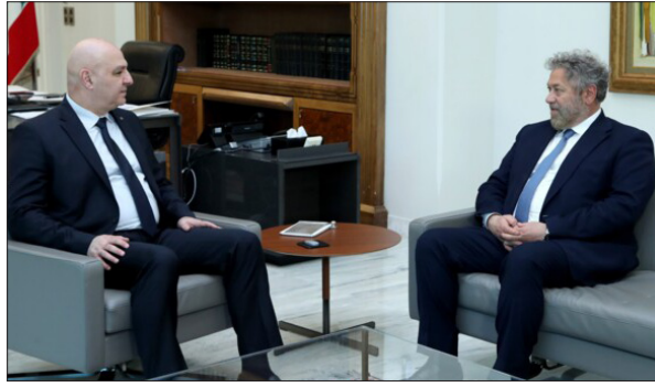
عون مستقبلاً إفرام في بعيدا أمس

وفي قصر بعيدا أيضا، النائب زياد حواط الذي أوضح أنه بحث مع الرئيس عون «الأوضاع العامة في البلاد ومسار العملية الإصلاحية وتطبيق القرارات الدولية»، مركزاً على «فئائية الإصلاح والسيادة». كما تطرق البحث إلى حاجات منطقة جبيل.