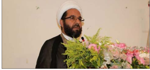
الشيخ علي دعموش

رأى نائب رئيس المجلس التنفيذي في حزب الله الشيخ علي دعموش أنّ «ما يتعرض له لبنان من احتلال واعتداءات واستباحة لسيادته، هدفه الأساسي هو الضغط لاستدراجه نحو التطبيع مع الكيان الصهيوني، لكنّ شعبنا يرفض التطبيع مع العدو، ولن يسمح بأن يذهب لبنان نحو التطبيع مع هذا العدو الإرهابي الذي دمر البلد».